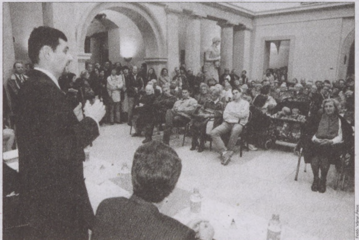
Dr. Nagy Gábor Tamás polgármester az elmúlt két év munkáját ismertette

„Amíg én vagyok a polgármester, egyszer sem fordulhat elő, hogy a bérlők feje fölül eladják az önkormányzati lakásokat. Nem kerülhet külföldiek tulajdonába a Budai Vár” - jelentette ki a napokban megtartott közmeghallgatáson dr. Nagy Gábor Tamás a Budavári Önkormányzat polgármestere. Azt, hogy a bérlők jóváhagyása nélkül nem lehetséges az értékesítés, várhatóan rendszerben írja majd elő a testület. Úgy tűnik, hamarosan arra is mód nyílna, hogy a műemlék-lakásokat a bennük élők megvásárolják.