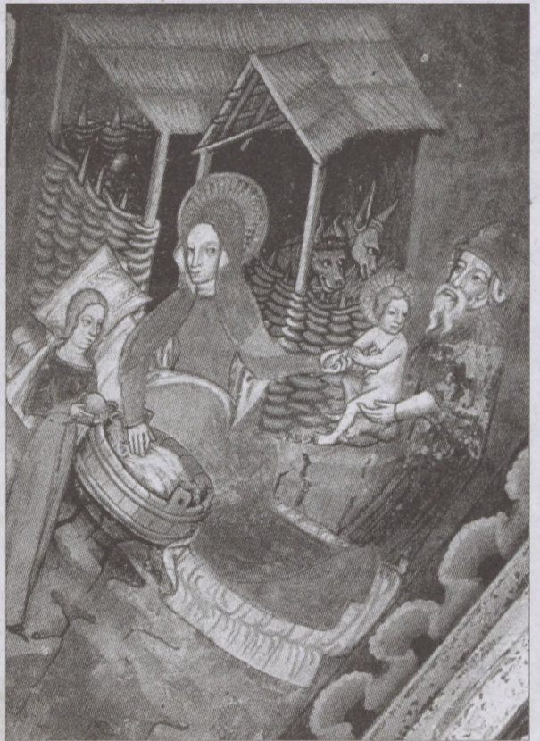
Jézus születése Almakerék szász erődtemplomának szentélyboltzatán (XIV. század, Nagy-Küküllő vármegye)