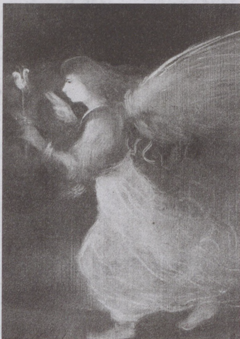
Az Angyal című festmény

- A kipusztított polgári gondolkodás és viselkedésmód arra sarkall, hogy a 20-as, 30-as évek felhasználható értékeit kiemelve, a