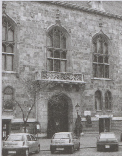
A volt műegyetemi kollégium épülete, ma a Magyar Kultúra Alapítvány székháza

maga már igazság, a még így fennmaradó stílushazugságot kell semlegesíteni”.