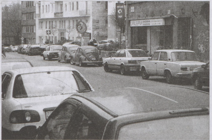
Rövidesen megszűnik a zsúfoltság és a szabálytalan parkolás a kerületben

ra két tervváltozat készült. Mindkét változat bizonyos elemek eredetivel azonos formájú visszaépítését irányozta elő. Lényeges különbség az Iskola utca teret érintő kialakításában volt. Az első változat az eredeti nyomvonalon az utcát levezetné a Fő utcára - emellett voksoltak a képviselők -, a másik változat parkot alakítani ki helyette. A lehajtó visszaépítésének több előnye is van: végre megszűnik az Iskola utca zsákutca jellege, nemcsak a Vár irányába lehet innen tovább közlekedni és nem utolsósorban az eredeti, történelmileg kialakult állapot áll helyre. E megoldás mellett foglalt állást