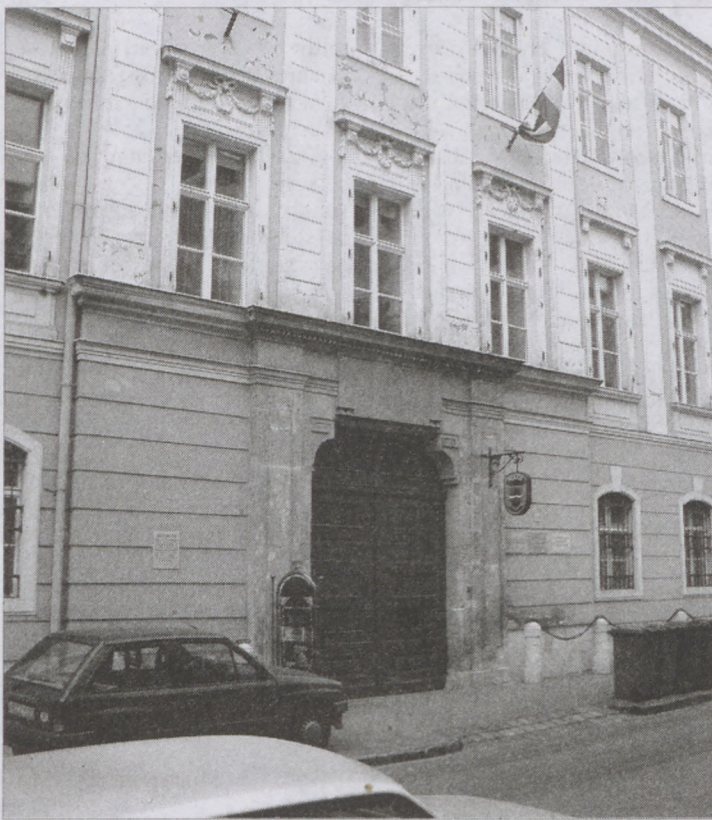
A Művészettörténeti Kutató Intézet épülete a Várban

csinálni, azzal a szándékkal, hogy a magyar művészekről minden létező adatot összegyűjtsön. Egy óriási szoba telt meg, rengeteg dobozzal, ahol mondjuk Munkácsyról több ezer cédula, újság kivágás található. Párját ritkítja a gyűjtemény, de egyre követhetlenebb és értelmetlenebb a rendszer. Másképpen kellene a jövőben gyűjteni, valamilyen módon szelektálni, jobban koncentrálni a mára. Hihetetlenül nagy kihívás az informatikai társadalom idején, - a digitális adatbázisok korában - ezt az anyagot újjá varázsolni.