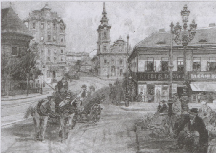
Zórád Ernő: Tabán – Döbrentei tér

múltat. Az önkormányzat így hát minden igyekezetével ápolja a Tabán emlékét, rendezvények, kiadványok, helytörténeti munkák, tanulmányok támogatásával, a még megmaradt, néhány épület fenntartásával. Mint mondta, emberi értékek szülőhelye, terem-