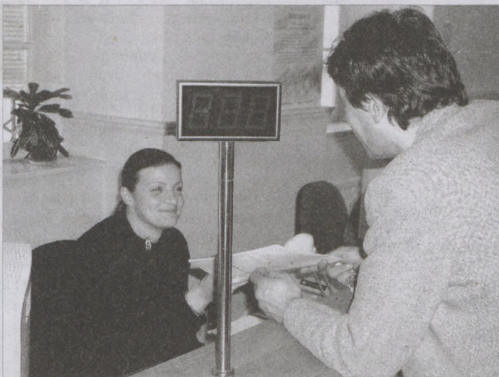
Több mint 250 ügyfél keresi fel hetente az okmányirodát