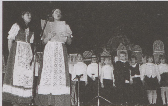
Nagysikerű esten emlékeztek a Battyhány Lajos Általános Iskola tanulóira az intézet névadójára.