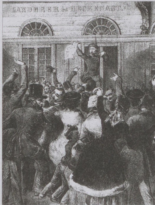
A pesti ifjúság ismerteti a nép kívánságát.

peinek egy szívben-lélelben egyesüléséhez van csatolva, ezen egyesülést nemzetiségeik respektálása mellett csak az alkotmányosság érdelemrokonító forrasztéka teremtheti meg. Bűró és bajonett (bürokrácia és szurony) nyomorú kapocs”. Részben nyíltan, részben a sorok közé rejtve, követelte Magyarországon a közteherviselés, politikai jogegyenlőség, népképviselőlet és a független nemzeti kormány megteremtését. Am ezel