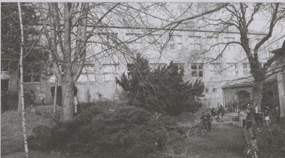
A lisznyais diákok előkelő helyezéseket érnek el a tanulmányi versenyeken

Iskolánk a Nap-hegy tetején található, nyolc évfolyamon két párhuzamos osztállyal működik, 1958-ban épült. A szép, egészséges zöldövezeti környezet, a friss levegő, a napfényes és derűs, otthonos hangulatú épület, valamint a remek közlekedés már önmagában is vonzó. Ehhez társul a stabil és jól felkészült pedagógusokból álló nevelői gárdánk munkája, melynek következménye - a magas színvonalú oktatás mellett - a családias, gyermekközpontú légkör.