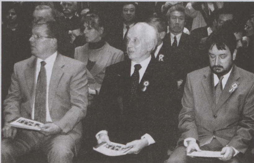
Matolcsy György gazdasági miniszter, Mádl Ferenc köztársasági elnök és Rockenbauer Pál kulturális miniszter a Budapesti Tavasz Fesztivál megnyitóján

románkori rekonstrukciók (a két alttemplomi lejáró, a nyugati márványkapu és a Szent Kereszt-oltár), a jáki templom szobrászati részletei, a sárospataki Öreg torony reneszánsz faragványai, valamint az esztergomi várkapolna rózsablakának kőrestaurátori munkálataiba. Az április 10-ig látható kiállítást Dávid Ferenc művészettörténész nyitotta meg.