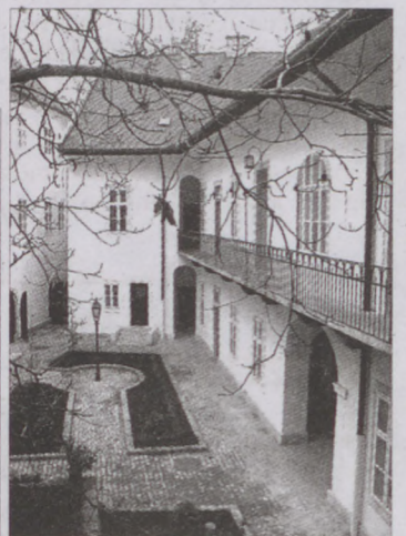
Az megszépült épületegyüttes