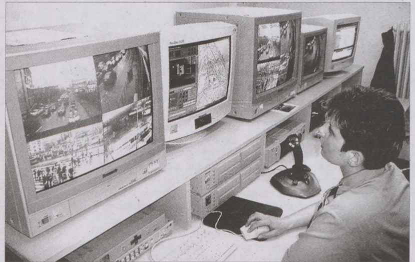
A nap minden órájában nyomon követhetők a forgalmas téren zajló események

A most befejezett első ütemben a Moszkva téren hat kamera működik, a felügyeleti központ a II. kerületi Rendőrkapitányság ügyeleti helyiségében üzemel. A kamerák és a központ összekapcsolására optikai kábeles jelátviteli hálózatot építettek ki. A téren hat digitális