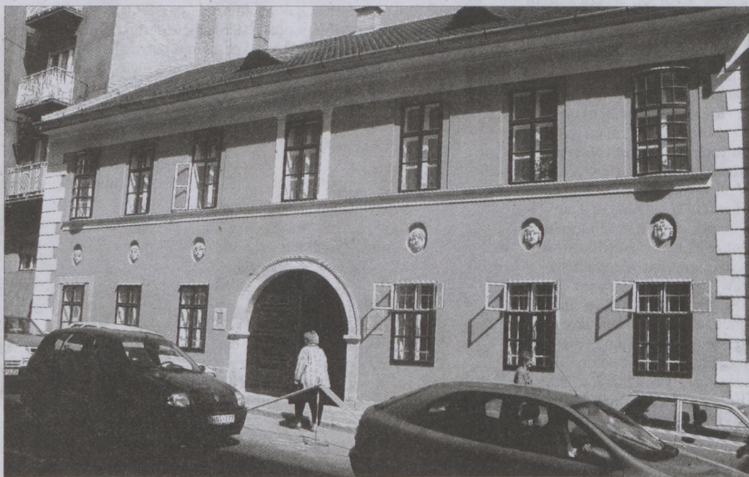
A Batthyány u. 25. szám alatti megszepült műemlék épület

Ismét eredeti szépségében pompázik a Batthyány utca 25. szám alatti műemlék épület. A nyolclakásos lakóház felújítása a Budavári Önkormányzat beruházásában készült el, a Fővárosi Önkormányzat rehabilitációs alapjának támogatásával.