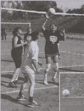
Kemény küzdelem árán sem sikerült a győzelem röplabdában

A "döntő-húzásban" kicsit tartottunk az óbudaiaktól, a Bud Spencer méretű ellenfelet látva,