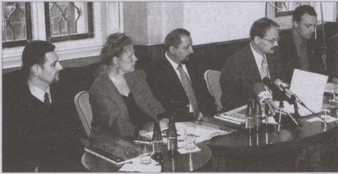
A hiánypótló kiadvány a budai polgármesterek támogatásával jöhetett létre

Könyvbemutatóra voltunk hivatalosak az Angelika kávéház belső termébe. Az első magyar ortofotó kiadványról tartott tájékoztatót a kiadó, az album megjelentetését támogató I.-II.-VI.-XI. és a XII. kerületi önkormányzatok vezetőinek közreműködésével.