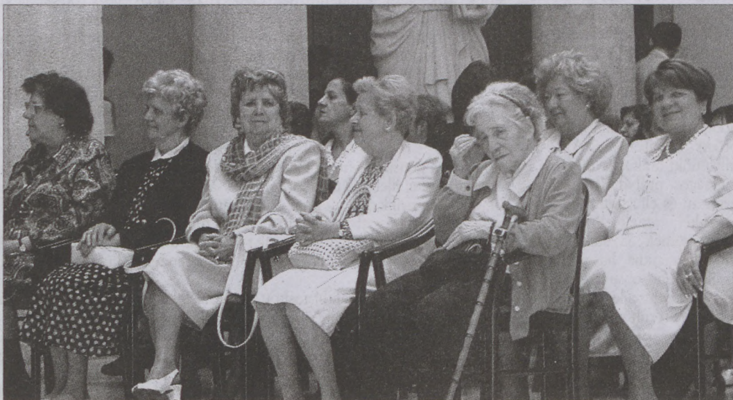
Színes diplomával ismerték el az idős pedagógusok több évtizedes áldozatos munkáját

Szép hagyománnyá vált a Budavári Önkormányzat Pedagógus napi ünnepsége a polgármesteri hivatal aulájában, június elsején a Liszt utcai Általános Iskola tanulójának közreműködésével köszöntötték az önkormányzat vezetői a tanárokat, tanítókat. A színvonalas műsorban hallhattunk verset és prózát, kórusműveket, hegedű és fuvolaszólót.