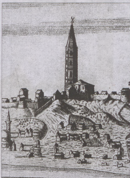
A mecsetté alakított Nagyboldogasszony temploma egy XVII. századi metszeten

mond és Mátyás uralkodása, minden várágzik, épül. A Vár palotái ekkor elkezdtek, dominikánus kolostor a Várban, ugyanott kibővíti a Nagyboldogasszony templomot és a Mária Magdolna templomot, felépül a Szent Zsigmond, Szent Miklós és az Evangélista Szent János templom. A külvárosokban a Szent Péter mártír temploma, a karmelita, pálos, klarissza és templárius kolostor. A fénykort hanyatlás követte, a török korban inkább pusztult, mint épült a város, mecsetek, fürdők és a várfalrendszer épült