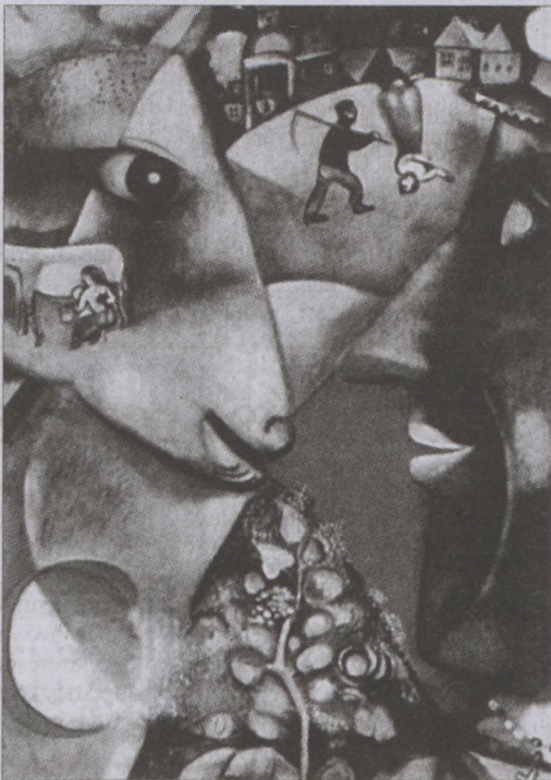
Chagall: Én és a falu

A Francia Intézet idén a legnevesebb francia és afrikai együtteseket hívta meg augusztus 1-re az óbudai Sziget Fesztiválra. A Noir Désir például a 90-es évektől kezdve rendszeresen nagy sikerrel kon-