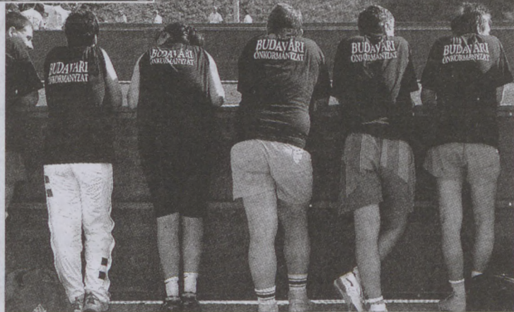
A győztesek a szurkolásban is élen jártak. Képünkön a nyertes csapat tagjai hátulnézetből.

Sajnos egy árva kosárral maradtunk el az aranytól, viszont nem "bosszúként" a kosárra dobásban szinte hibátlanul söpörtük be az aranyérmeket!