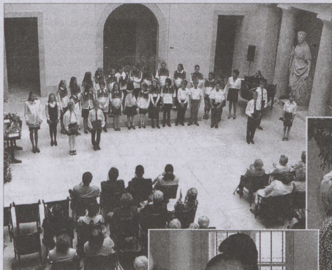
Versekkel és dalokkal köszöntötték a pedagógusokat a Lisznyai utcai iskola diákjai