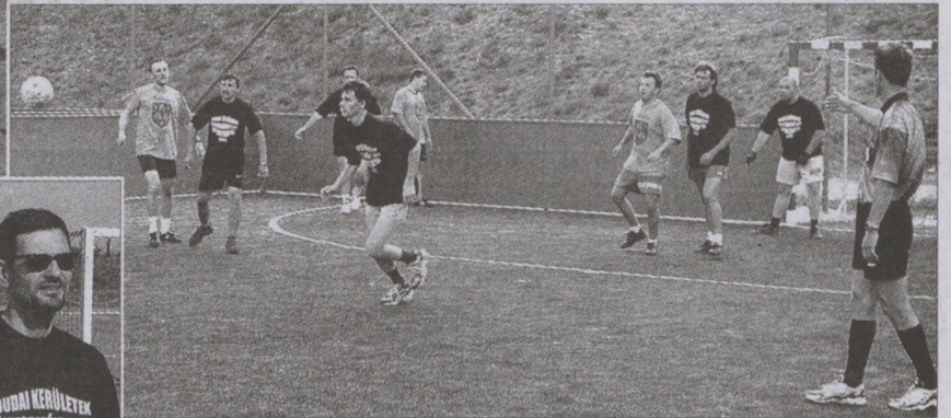
Labdazsonglőrök a pályán