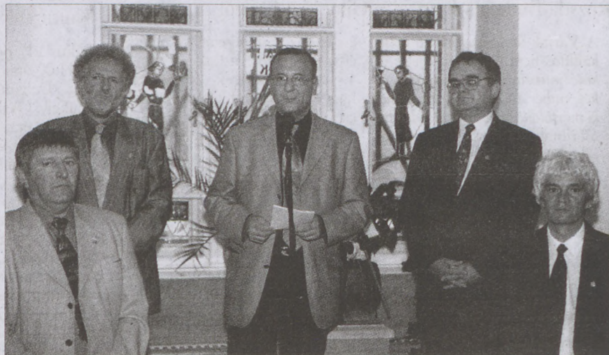
Dr. Bártfai Béla államtitkár (középen) köszöntötte az ország legkiválóbb borászait

Történetének jelentős eseményéhez érkezett a Magyar Borok Háza: június 29-én ugyanis felavatták az elmúlt tíz évben az "Év Bortermelője" büszke címet elnyert mesterborászok emlékfalát. A kilencvenes évtized első évének úttörő vállalkozása ugyanis immár tíz, méltán kitüntetett szakembert hozott premierplánba, akik rengeteget tettek azért, hogy a szőlőben és a borban rejlő nemzetformáló erő az elmúlt évtizedben egyre látványosabb sikereket érjen el.