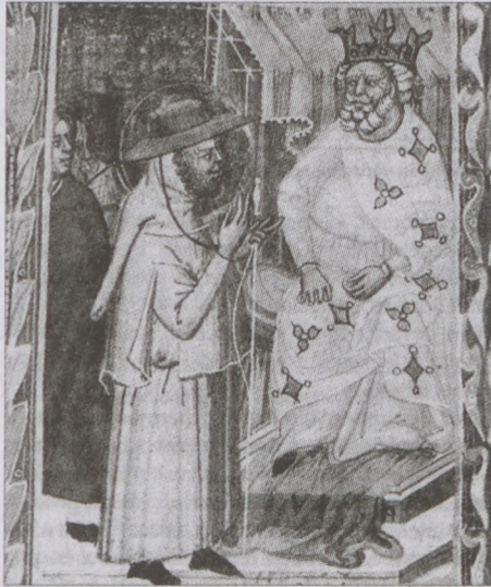
Szent István rábeszéli a zarándokútra induló Gellértet, hogy maradjon Magyarországon

egyetlen műve maradt az utókorra, a tüzes kemencébe zárt három héber ifjú történetének magyarázata latin nyelven. 1030-ban bízta meg őt Szent István király a marosvári (csanádi) püspökség megszervezésével. Gellért itt püspöki székesegyházat építtetett, Mária monostort ala-