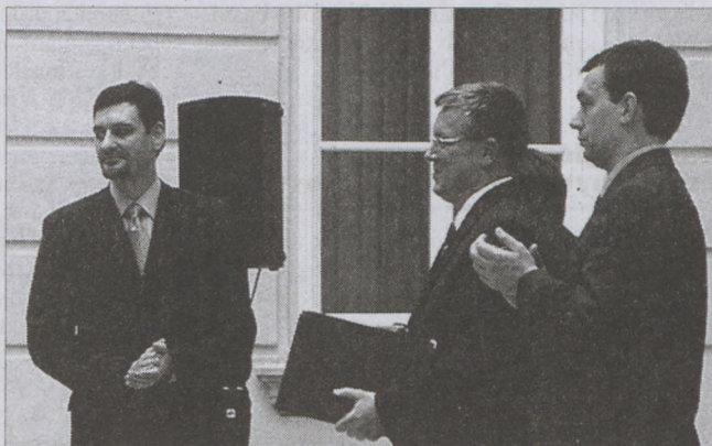
Az első kerület adott otthont a Széchenyi terv jövő évi pályázati lehetőségeit ismertető rendezvénynek. A képen: Nagy Gábor Tamás a vendéglátó Budavári Önkormányzat polgármestere, Matolcsy György gazdasági miniszter és Orbán Viktor miniszterelnök

A végeredmény: az idei nyertes pályázók a Széchenyi Terv támogatásával 284 milliárd forint értékű beruházást realizálnak, több mint 22.500 új munkahely jön létre és mintegy 3000 új bérlakás épül. A Széchenyi Terv keretében megítélt minden egyes forint állami támogatás öt forintot mozgat meg a magyar gazdaságban. Az energiatakarékos program keretében nyertes pályázatok beruházásai révén 590 ezer GJ megtakarítás érhető el, ami több mint 10 ezer magyar család éves energiafelhasználásának felel meg. Bár e körből került ki a legtöbb nyertes pályázat, a támogatás értékét illetően vezet a turizmus, ebben a kategóriában 22 milliárd forintot nyertek el a pályázó vállalkozások, az egyházak