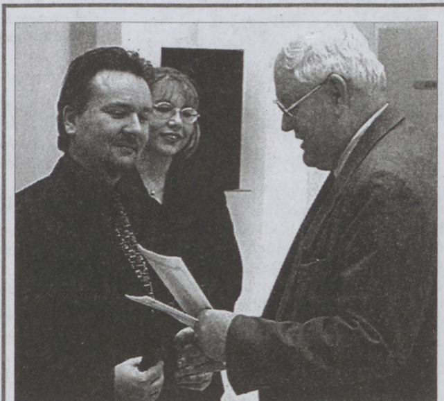
Sikerrel szerepeltek a kerület civil szervezetei a Széchenyi terv pályázatán. Lapzárta után a Városháza aulájában 34 első kerületben működő civil szervezetnek gratulált és nyújtott át oklevelet Sik Zoltán (a képen balra) informatikai kormánybiztos. Közérdekű társadalmi cél érdekében kifejtett tevékenységüket a pályázaton elnyert számítógéppel ismerte el az Informatikai Kormánybiztoság.

A délután 5-től este 10 óráig tartó közmeghallgatáson még számos kérdés szóba került, köztük sok olyan is amelynek megoldása nem tartozik az önkormányzat hatáskörébe. Ezeket a felvetéseket továbbítják a Fővárosi Önkormányzatnak, illetve az érintett hivataloknak, hatóságoknak.