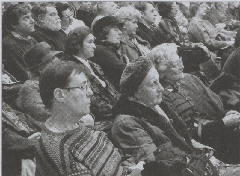
A közmeghallgatáson zsúfolásig megtelt a Városháza aulája

Idén először lehetett e-mail-en is kérdéseket, illetve javaslatokat küldeni közérdekű témákban a polgármesteri hivatalba. A polgárok éltek is a lehetőséggel: a kérdések több mint fele elektronikus úton érkezett. Az elektronikus levelezés közvetlen és gyors kapcsolatteremtésre nyújt módot a lakók és az önkormányzat között, a tervek szerint a hivatali ügyintézésben is a mindennapok gyakorlatává válik - kezdte beszámolóját dr. Nagy Gábor Tamás polgármester november 15-én a polgármesteri hivatal aulájában megtartott közmeghallgatáson.