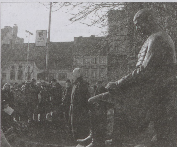
Megemlékezés Kölcsey Ferenc szobránál a kultúra ünnepén