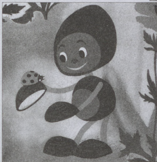
Részletek a Kippkopp a fűben című mesekönyvből

- Boribon, egy játék macskáról szól, az idén japánul is meg fog jelenni. Életem legnagyobb sikerét adta a Laci és az oroszlán; ez a fiúkról szól, a bátorságról. Utána írtam A csúnya kislányt, amelyben a szépséget, a tündér kedvességet fogalmaztam meg... A Boribon és Annipanni sorozat, öt mese készült el belőle, 2-3 éves kicsiknek