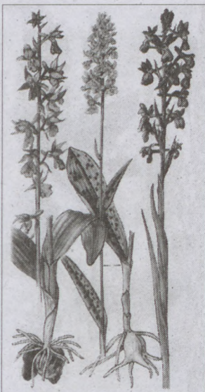
Erdő-mező virágai: kosborok