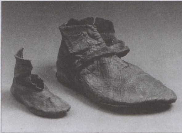
15. századi bőr cipők

valójában nem is volt tér - ennek a területnek a korabeli arculatáról leginkább a régészeti leletek adnak részletesebb képet. A reneszánsz időszakot elsősorban egy, a 16. században épült városi palota és két középkori egyházi intézmény, a ferences kolostor és a Szent Zsigmond templom emlékműve jeleníti meg. Am nem csak az egykori épületek elhelyezkedéséről, hanem a korabeli falak közt zajló életéről is ismereteket kaphatunk a középkori leletekből. A volt Teleki palota mélypincéjében megtalált középkori kút feltárása során pártatlan mennyiségű és értékű leletanyag bukkant elő. A