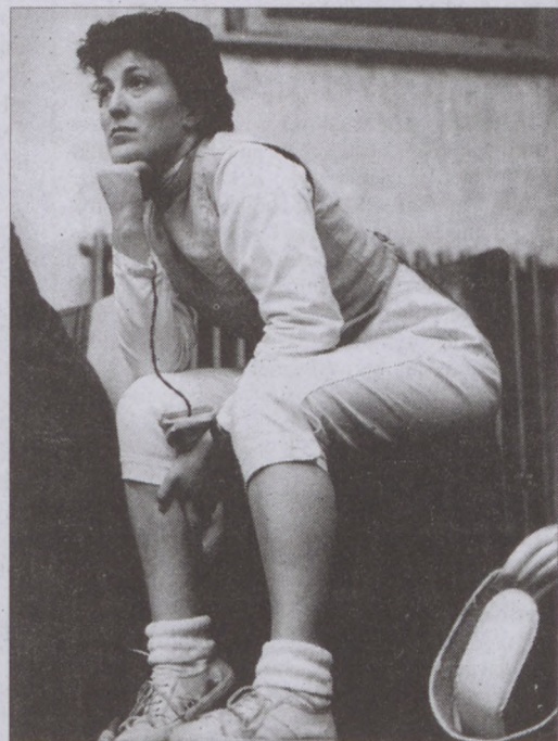
Két asszó között

- Vegyész vagyok, Szegeden végeztem. Pestre is így kerültem, nem mint versenyző. Az akkumulátorgyárban dolgoztam fejlesztőmérnöként és onnan is mentem nyugdíjba... Mikor abbahagytam a sportot, gondoltam, majd edző-