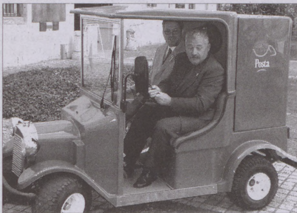
Próbaúton az elektromos kisteherautó

A múlt század elején a Magyar Posta használt elsőként elektromos járműveket. Naponta 2200 postai jármű rója az utakat. A környezet megóvása érdekében kezdték meg a - gépjárműfej-