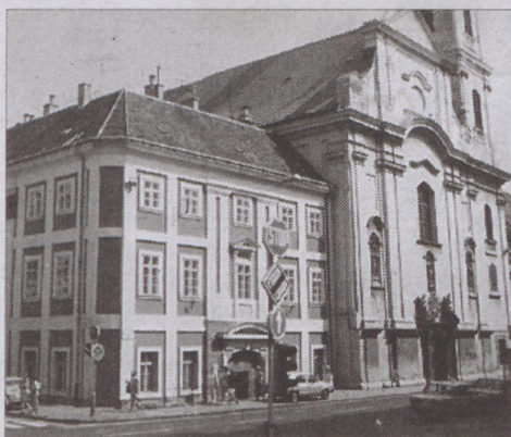
Az Erzsébet-rendi apácák temploma és a Marczibányi-menhely