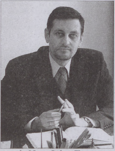
dr. Nagy Gábor Tamás

a 01. számú egyéni választókerület országgyűlési képviselője