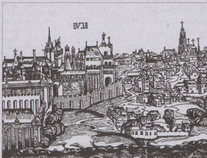
Buda az 1400-as években (Schedel Világkrónika)

A polgárokon kívül mások is éltek itt, szegé- nyebb sorsú, vincellérek, hajósok, vízhordók, napszámosok, szolgák. A hierarchia alsó részén foglaltak helyet a koldusok, csavargók és a bél-