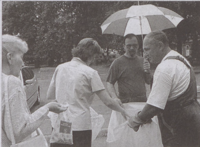
Délutánra megteltek a zsákok a veszélyes hulladékkal