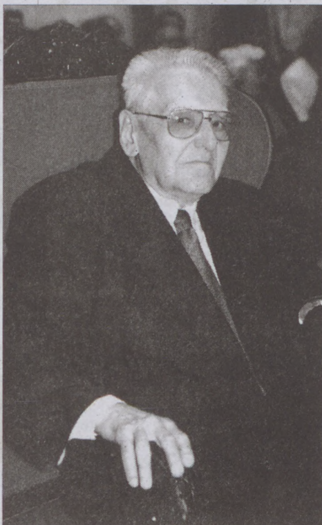
„Mindig igyekeztem konszenzust teremteni”

- A testvérvárosi kapcsolatokra. Marosvásárhelyhez és a francia Carouge-hoz szoros szálak fűzték a testületet. A francia kisvárosban