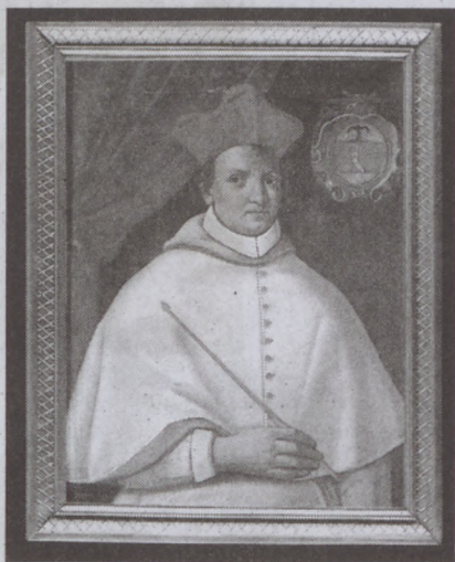
Fráter György (XVIII. századi ismeretlen festő műve)