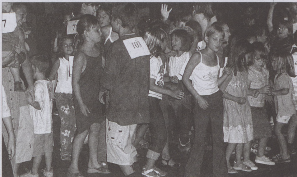
A gyerekek körében nagy sikert aratott a táncverseny

mes szegezni tekintetünket, ahol színpompás tűzijáték gyönyörködtette a vendégeket.