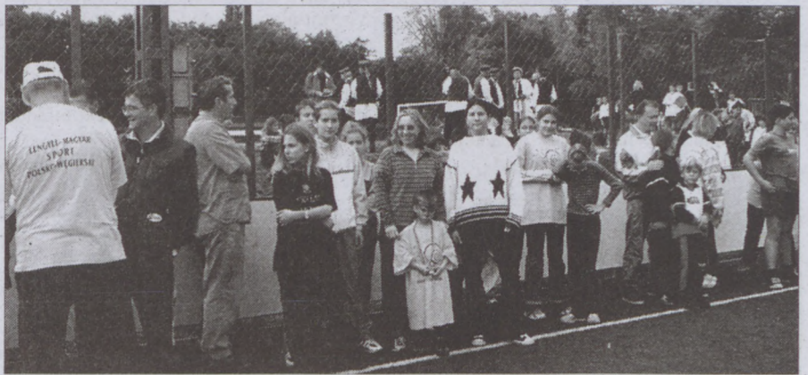
Biztatásból nem volt hiány a lengyel-magyar sportnapon

A sikeres sportnap támogatói sokat emeltek a színvonalon, így az Akadimpex, Scholl, a Red Bull, a Nestlé, a Közlekedési Múzeum, az ESMA Spanyol-magyar Reklám Kft., Pal Zileri, az I. kerületi Polgári Vé-