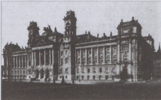
A Curia épülete 1900 körül