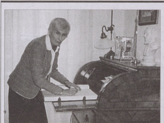
Mádli Dalma asszony, a köztársasági elnök felesége is megtekintette a Városháza aulájában megrendezett kárpitkiállítást. Képünkön a köztársasági elnök felesége üdvözlő sorokat ír az önkormányzat vendégkönyvébe.

Az esemény zárásaként a Kölcsey Ferenc Gimnázium énekkarának előadásában két kórusmű hangzott el, majd a jelenlévők közösen elénekelték a Szózatot, végül a polgármester mindenkit meghívott a Városháza Aulájában megrendezett Kárpitkiállítás megnyitására.