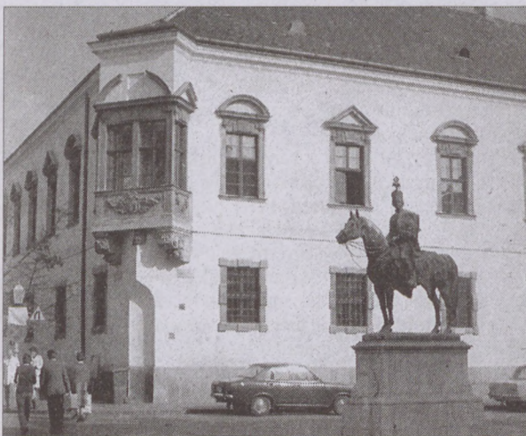
A hajdani budai Városháza épülete