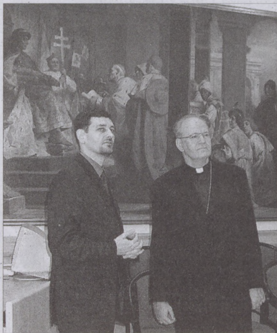
Erdő Péter bíborosnak dr. Nagy Gábor Tamás polgármester mutatja be a Városháza épületét

Erdő Péter kijelentette: az önkormányzat és az egyházmege között hagyományosan jó a kapcsolat. Nem csak a műemléképületek megóvásában, hanem kulturális és szociális területen is jelentős támogatást kap-