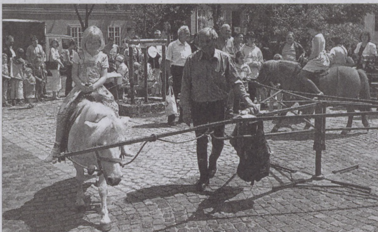
A bátrabbak a pónilovaglást is kipróbálhatták