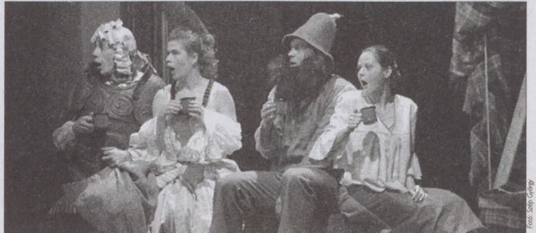
A Meseudvarban kedvenc mesefiguráikkal találkozhatnak a gyerekek

Információ: Interkultur Hungaria Kht. 1074 Budapest, Rottenbiller u. 16-22. Tel: 462-0330. Fax: 342-9362. E-mail: bacs@interkul-tur.axelero.ne.