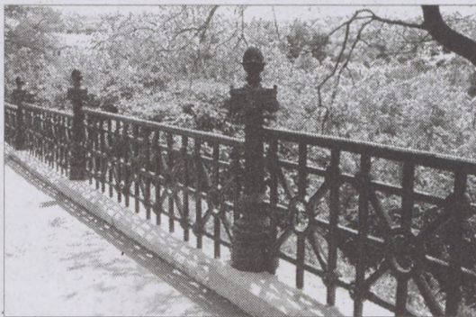
Elkészült az Ybl korlát egy új szakasza

zajlanak. A fásori munkálatok keretén belül még mindig a száraz fák és ágrészek eltávolítása folyik. Rendszeresen takarítjuk az önkormányzat tulajdonában lévő üres telkeket, sajnos ez csak rövid ideig látható. Gondoskodunk a fák folyamatos növényvédelméről, túl vagyunk a lemosó permetezésen,