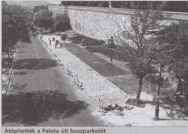
Átépítették a Palota úti buszparkolót