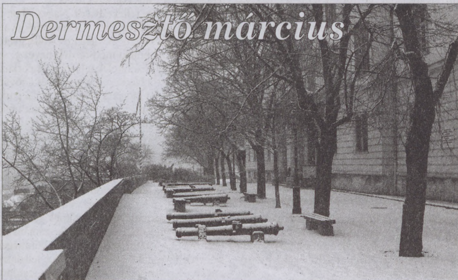
Nyoma sincs a várva-várt tavasznak. Február végén köszöntött be az igazi tél.