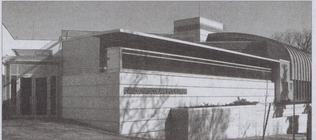
A Cardiovascularis Centrumban optimális feltételek mellett gyógyítanak az orvosok

Hiába azonban a legoptimálisabb feltétel, ha a beteg nem veszi komolyan a tüneteket, s nem fordul időben orvoshoz akár tudatlanságból akár félelemből. A fővárosban egyébként a lakosság egészségi állapota valamivel jobb mint vidéken, talán mert több az orvos, s az emberek alaposabban tájékozódnak az egészségükre leselkedő veszélyekről. Nem véletlen, hogy a várható élettartam Budapesten és Győr-Sopron megyében a legmagasabb.