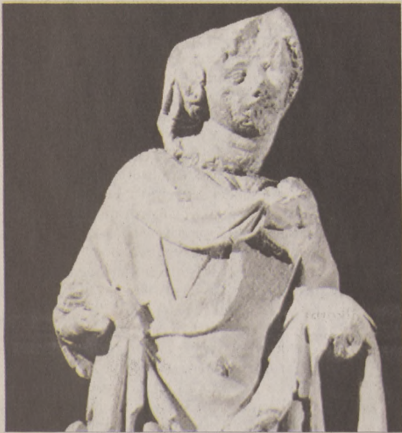
A budai Fehér Madonna

Kevesen tudják azonban, hogy kisgyermekkorától itt élt a kerületben, sőt pont a kerület határán született, a Vérmező közelében, a Krisztina körút és a Bors utca (ma Hajnóczy József utca) sarkán. A dátum: 1916. március 16. Az első gyermekekéiben ebben a lakásban teltek. Szülei válása vetett véget ennek, a kisfiú ezután édesapjával a Tabánban lakott, a Szent János téren egy tipikus, földszintes, igazi tabáni házban. 1930-ban meghalt az édesapja, a tizenéves fiú ettől kezdve édesanyjával lakott a Bethlen udvarban. Későbbi visszaemlékezésében, életrajzi kötetében, mely a „Hírünk és hamvunk” címet viseli, nagyon érdekesen írja le ezt a házat. A Bethlen udvar az 1920-as évek elején épült, tájidegen monstrum volt, nem illett sem a Tabán kis házaihoz, sem a Vár és a Gellért-hegy közelségéhez. Többen laktak benne, mint egy alföldi faluban. És milyen vegyes népesség! A Trianon utáni Magyarország, a magyar társadalom keresztmetszete volt ez az állandóan cserélődő, nyüzsgő embertömeg. A fiút a közeli Werbőczy (ma Petőfi) gimnáziumba írták.