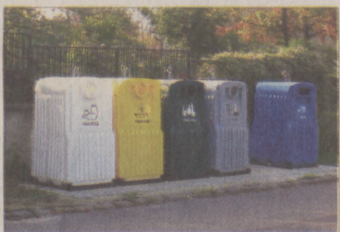
Szelektív hulladékgyűjtő sziget a Gellért-hegyen

Három új helyszínnel bővült a szelektív hulladékgyűjtő szigetek száma az I. kerületben. A Logodi utca - Mátray utca saroknál a támfal mellett, a Toldy utca 25. szám előtt, a Kagyló lépcső mellett és a Sánc utca - Mihály utca sarkánál találhatók az új tartályok.