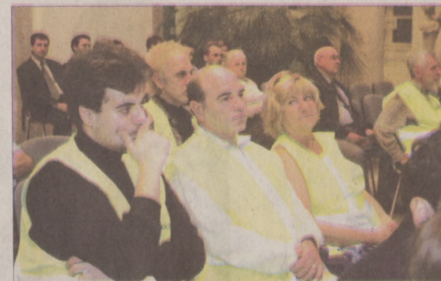
A polgárőrség a lakosság érdekében működő civil szervezet

A rövid helyzetértékelést követően a kapitány ismertette az aktuális statisztikákat. Mint kiderült, idén szinte minden bűncselekmény típusban jelentős csökkenés következett az előző év hasonló időszakához képest. Kevesebb volt a rablás, a gépjárműves bűncselekmény, - a gépjármű lopások száma 186-ról 96-ra csökkent - azonban kicsit több a lakásbetörés, igaz a Naphegyen a polgárőrség megalakulása óta egyetlen esetet sem jelentettek.