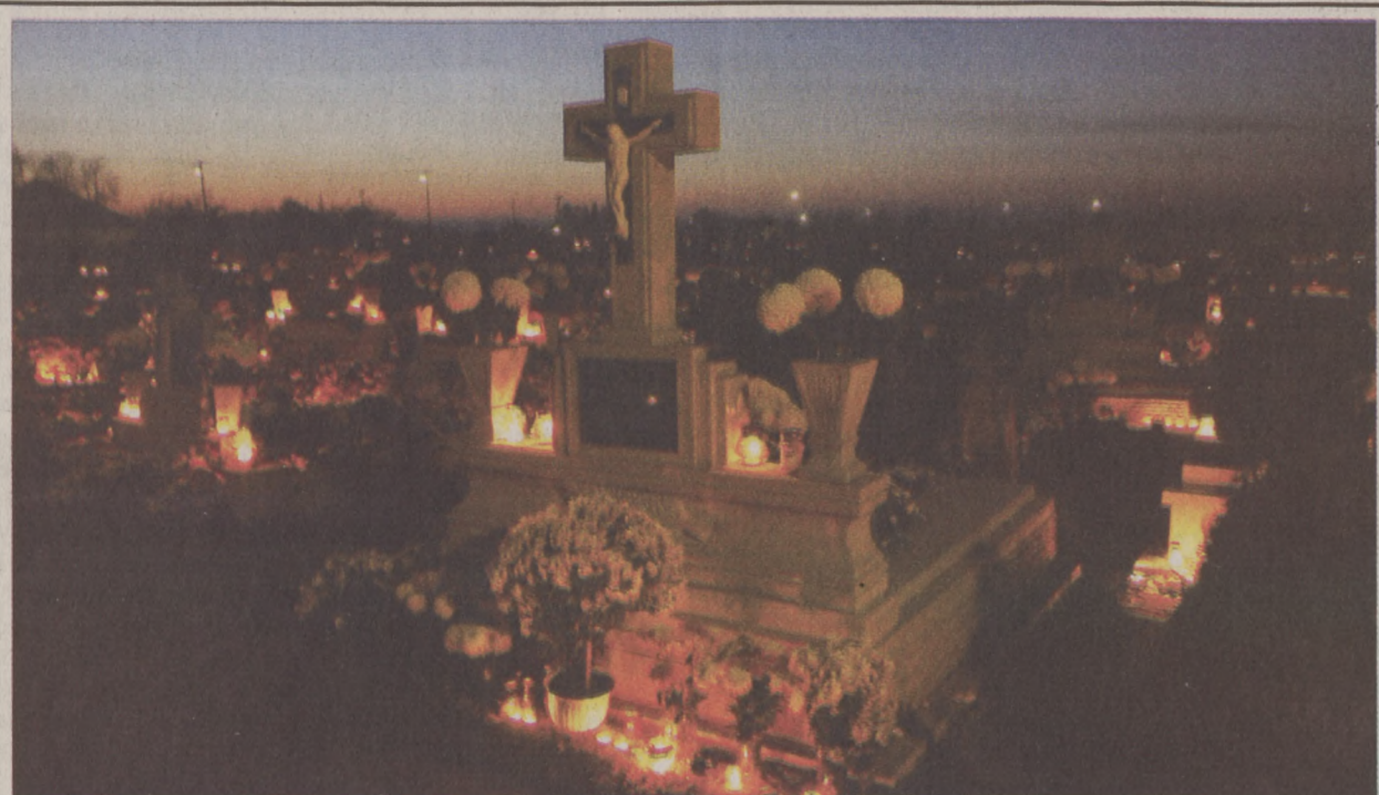
Halottainkra emlékeztünk. Halottak napján több százra gyűjtött gyertyát szeretettel emlékezve a fővárosi temetőben. Sokan már a hét végén és Mindenszentek napján lerótták kegyeletüket elhunyt hozzátartozóik sírjainál.