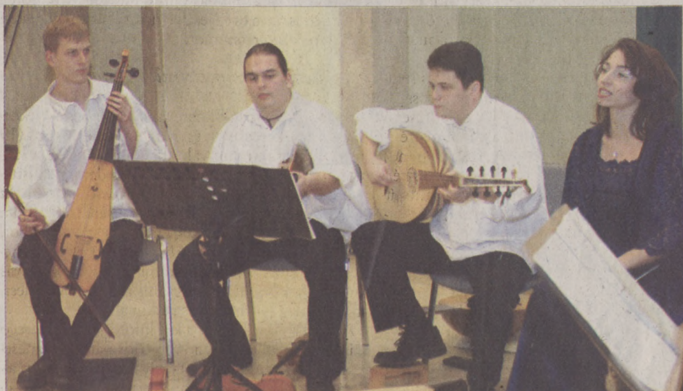
A Tabulatúra régizene-együttes korhű hangszerelésű dalokkal idézte fel a karácsony hangulatát

hinni, hogy meg lehet vásárolni mások szeretetét, ám a legtisztább emberi érzelm semmilyen eszközzel nem vásárolható meg. Az adventi hangversenyek megkönnyítik, hogy az ünnepi teendők elvégzésén túl, legyen idő és alkalom a