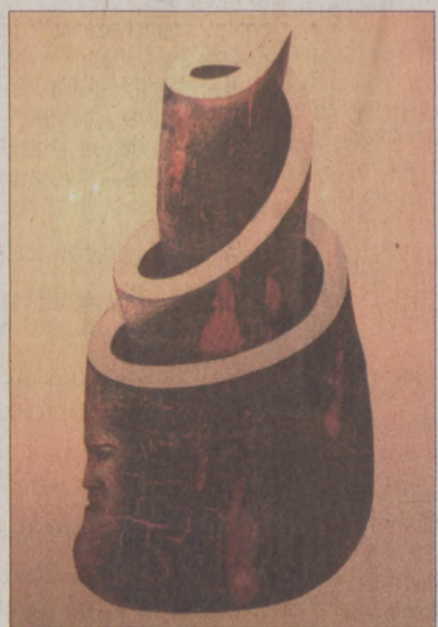
Szurcsik József alkotása

Az 1960-as évek első feléig elsősorban a figurális munkák kaptak nyilvánosságot. A hatvanas évtized közepétől azonban a művészek kijutottak a velencei biennáléra, így a hazai grafika nyitottabbá válhatott. A kiállításon Gross Arnold és Kondor Béla egy-egy alkotása „illusztrálja” az '50-es évek szemiatizmusában is saját utat járó művészek világát. Gross Erdélyi táj című