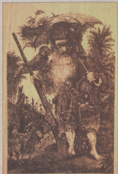
Gyulai Líviusz grafikája

látható a sokszínűség. Milyen technikákkal készülnek a kortárs grafikák?