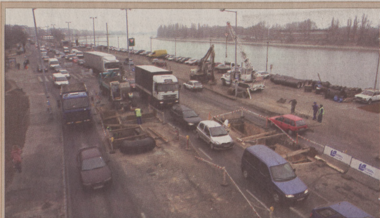
Forgalmi dugók a rakparton. A nyári forgalomelvezések megpróbáltatásai után újabb dugók nehezítik a közlekedést Budán. Az Árpád fedelelem útja - Bem rakpart útvonalon a Margit hídnál mindkét irányban elkerítették egy-egy forgalmi sávot, mert felújítják a vízvezetékét. Torlódásra számíthatnak az autósok a környező útvonalakon is.

helyettes államtitkár örömeinek adott hangot, hogy a magyar kultúra napjához kötődve ezúttal a népi kultúra is reflektorfénybe került. Elmondta, hogy az erősödő civil szervezetek, a hagyományokat továbbadó nevelőmunka és a tehetséges fiatal mesterek jelentkezése nyomán idősebb és szükségszerű volt az ország első