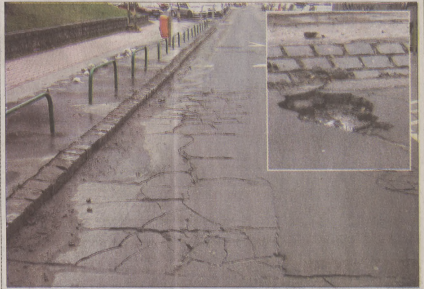
Képelnek a Krisztina körúton és a Lánchíd utcában készültek

A fővárosi szinten most életre hívott kátyúvonal az I. kerületben már évek óta működik. Az önkormányzat zöld számán a lakosok nemcsak a kátyúkat jelenthetik be, hanem minden más