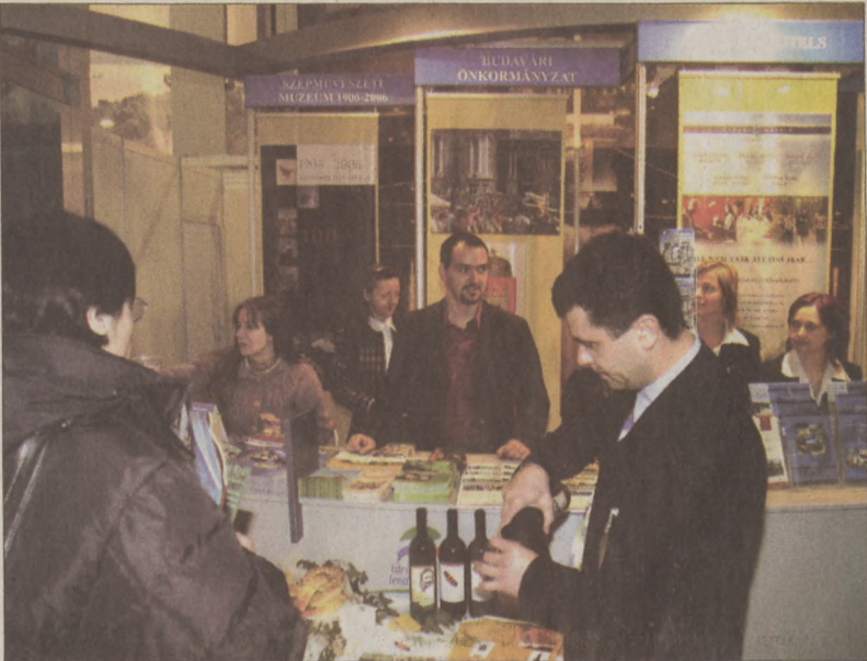
Az „Utazás 2006” kiállításon a Budavári Önkormányzat standján Lendva is helyet kapott

A tárgyalások során körvonalazódott, hogy a Budavári Önkormányzat támogatni tudja Lendva szereplését a tavaszi budapesti turisztikai kiállításon, a helyi borászok részvételét a hagyományos budai borfesztiválon, valamint Lendva és környékének megismertetését a kölcsönös kulturális cserekapcsolatok ösztönzése révén. A jelenlegi tervek szerint májusban az önkormányzat hivatalos delegációja képviselné a kerületet a lendvai gasztronómiai és borfesztivál alkalmával, melynek keretében kerülne a testvérvárosi szerződés aláírására.