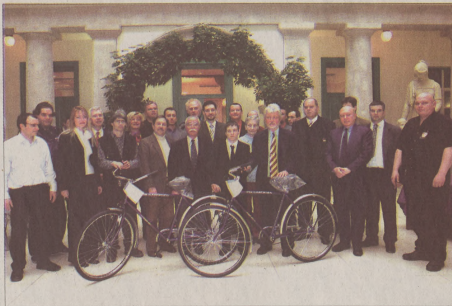
Sikeres vizsga után huszonegyen vehették át a polgárőr igazolványt