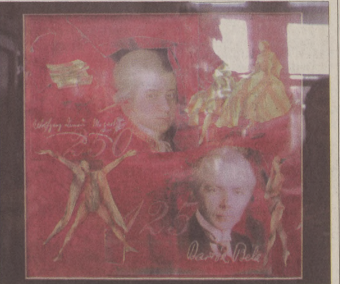
Mozart és Bartók emlékére rendezett kiállítást a Budavári Kárpitműhely

Bár a több évszázados tradíció ezt a művészeti ágat csoportos munkaként tartotta számon - hiszen annak idején a festő készítette a képet, kartonfestő szőhető műve alakította, amelyet aztán a műhelyrajz követett - napjaink művészei minden fázist egy személyben képesek elvégezni. A kortárs kárpitművészet egyedi alkotóhoz köthető. A művészi kárpit rangját jelzi a Szépművészeti Múzeum múlt év decemberében és idén janu-