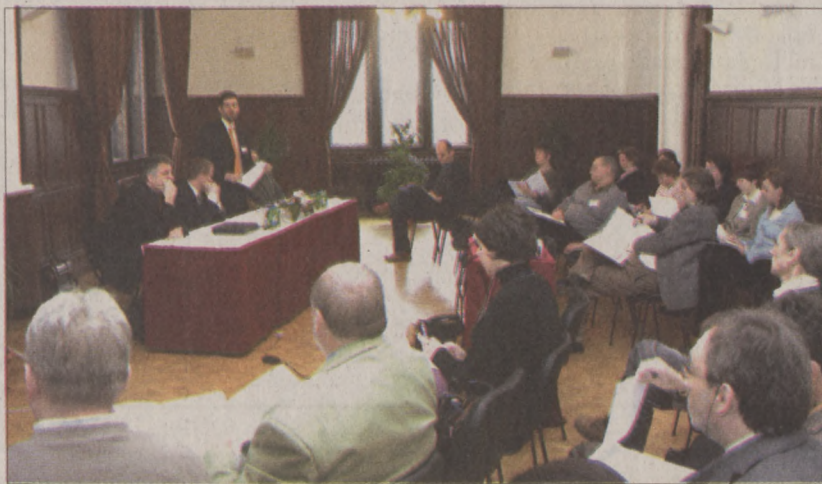
Az utóbbi években is emelkedett a kábítószerhasználók száma

stratégia kidolgozásához is felhasználható. Ehhez segítésként, a KEF szakmai háttérrel is biztosít. A kerületi stratégia alapelvei a tárgyilagosság, a szolgáltatói intézmények támogatása a fejlesztésekben, az együttműködés és szakmai munka, valamint a szociális érzékenység elve. Az irányelvek négyes pillére a közösség és együttműködés, a kínálatcsökkentés, a prevenció és a kezelés-ellátás szervezése. A célkitűzések követik a nemzeti stratégiát, melyekhez rövid, közép és hosszú távú programok csatlakoznak.