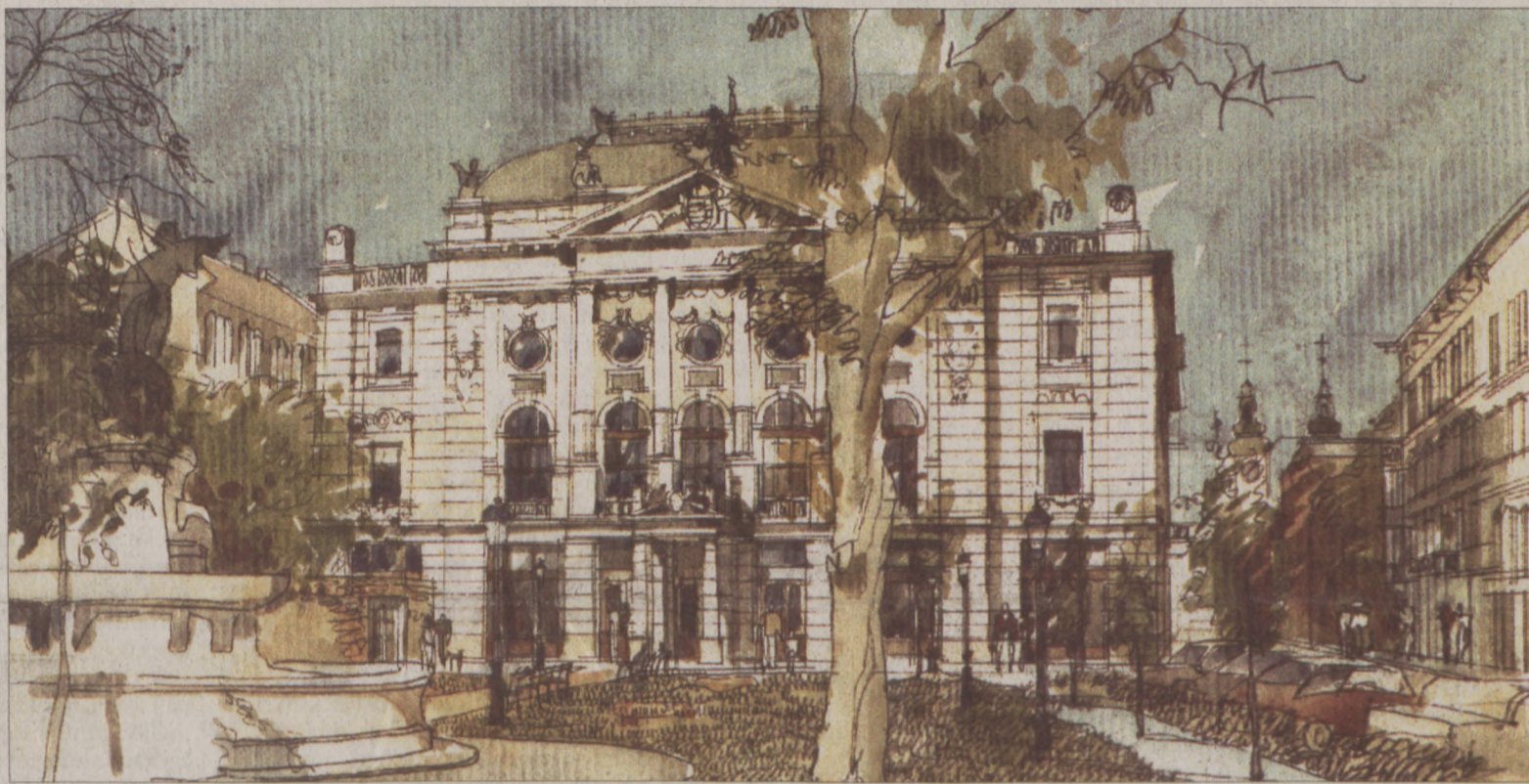
A patinás Corvin téri épületet az eredeti tervek alapján állítják helyre. A látványterv Horváth Sándor munkája

Hamarosan régi fényében pompázhat a Budai Vigadó, hiszen nemrég megkezdődött az eddig meglehetősen elhanyagolt épület felújítása. A tervek szerint nyár közepére befejeződik a rekonstrukció, melynek zárásaként karakterisztikus díszvilágítást kap a Corvin téri kulturális intézmény.