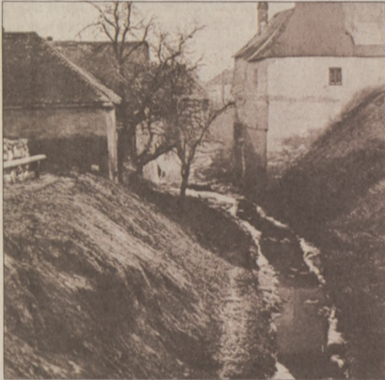
Az Ördögárok tabáni szakasza beboltozás előtt, 1880 körül

Mi is ez az Ördögárok? Tektonikus és eróziós pataként indul Nagykovácsiból, hogy tizenkilenc kilométeres útját megtéve elérje a Dunát. Hatalmas vízgyűjtő területe van, a Budai hegység vizeinek nagy részét felveszi. Máriaremetét, Hűvösvölgyet, Lipótmezőt átszelve érkezik Pasarétre és innen már beboltozva fut tovább a Városmajor és a Vérmező mellett a Horváth-kertben és a Tabánban. Az Erzsébet híd budai hídfőjénél ömlik a Dunába, itt emléktábla is jelöli torkolatát.