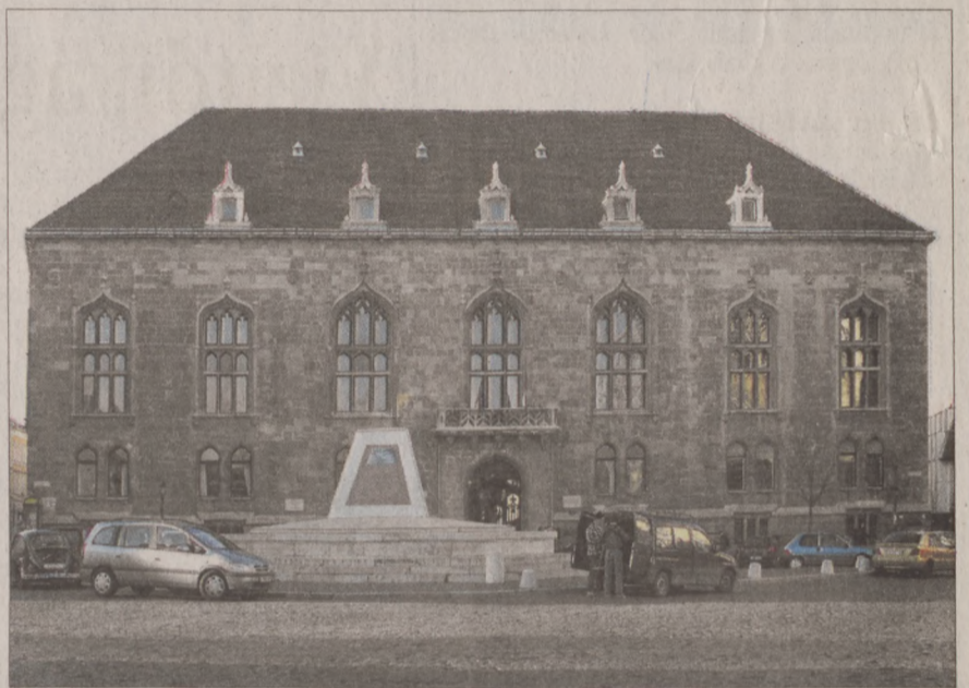
Tizenöt éve kapta meg a Szentháromság téri épületet a Magyar Kultúra Alapítvány