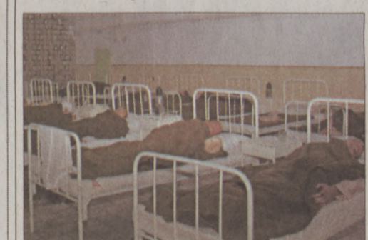
A vaságyakon fekvő viaszbábuk döbbenetes élményt jelentettek a látogatóknak