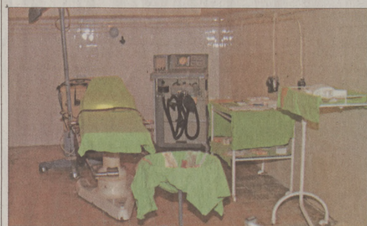
A föld alatti ellátó-helyet a Szent János Kórház működtette

Budapesti Történeti Múzeum Vármúzeum (Budavári Palota E épület) Nyitva: szeptember 15-ig 10.00-18.00 mindennap Állandó kiállítások - Ősi népek, antik kultúrák - Budapest története az őskortól az avar kor végéig - Buda középkori királyi várpalotája - Budapest a középkorban - Gótikus szobrok a budai királyi palotából - Budapest az újkorban Időszaki kiállítások Földszinti kiállítóter „Történelmünk korszakalkotója - Batthyány Lajos miniszterelnök”. Nyitva: október 30-ig Metszettár , „Erzsébet királyné a budai palotában” Nyitva: szeptember 30-ig I. emelet: „Kabaré 100 - Amikor a humorban még nem ismertek tréfát”. Nyitva: szeptember 20-ig