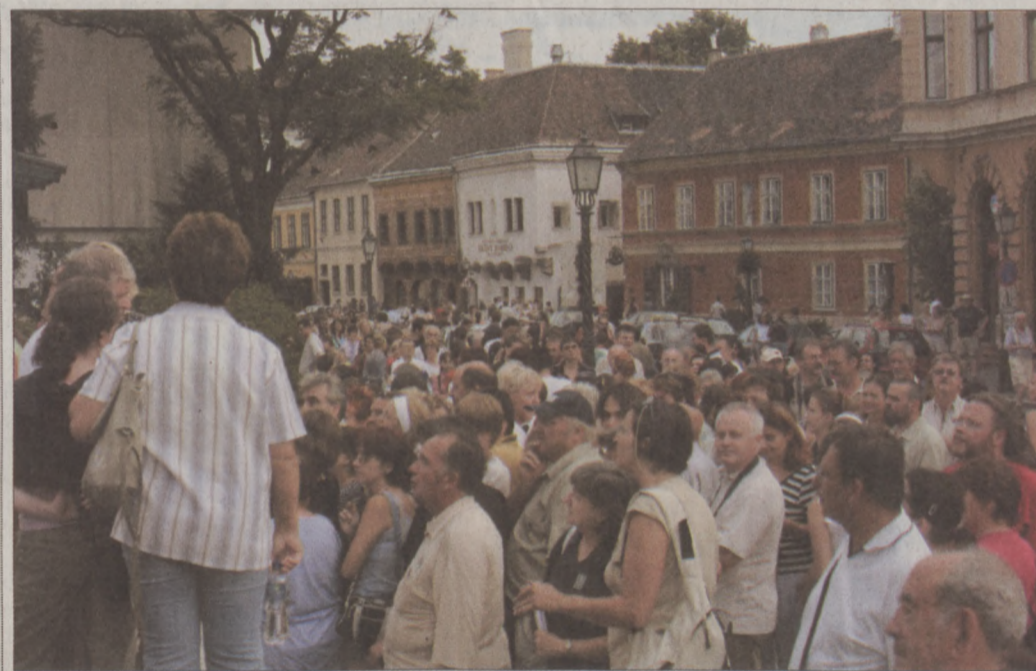
A Sziklakórház bejáratától a Dísz térig állt a sor a Múzeumok Éjszakáján