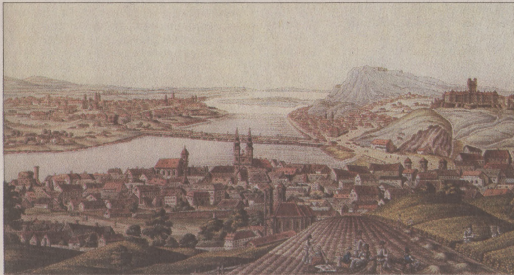
Kétszáz éve egyetlen hajóhid kötötte össze Pestet és Budát. I. és P.Schaffer: Látkép a Rózsadombról

Nem mai dolog tehát a szélsőséges időjárás, eleinknek is volt benne része. A természet erőit ma sem tudjuk megzabolázni, csak esendő embereként próbálkozunk vele. dr. Reisinger Frigyesné