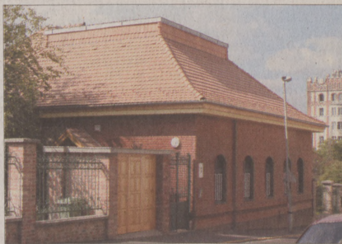
I. kerületi Nevelési Tanácsadó és Logopédiai Intézet

Az egykori óvodaépületben a Nevelési Tanácsadó és Logopédiai Intézet minden munkacsoportja megfelelő elhelyezést kapott. Külön