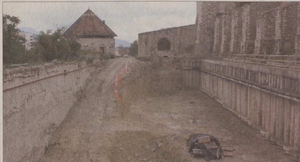
A Zsigmond-korabeli falszakasz felszínre kerülése miatt módosítani kellett a terveket

Az új terveknek köszönhetően a középkori lőréses várfal egyetlen követ sem kell elmozdítani, ráadásul a garázs használatától függetlenül bárki megcsodálhatja majd ezt a ritka kulturális értéket. A garázs oldala ugyanis nyitott lesz, így semmi sem takarja el a feltárt várfalat, amit egyébként meg is világitanak majd. Jelenleg az új tervek engedélyeztetési eljárása folyik, melyben nagy segítséget jelent a Budavári Önkormányzat