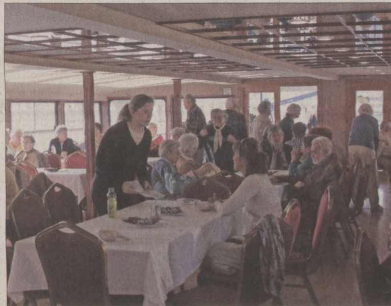
A hajón terített asztallal várták a vendégeket

nevezetes váci fegyházzal, különböző időszakokkal, híres lakóival és mostani helyzetével. Átmentünk a diadalív alatt, mely Mária Terézia tiszteletére készült. Az egyik régi városkapu, a Bécsi kapu nemrég újították fel. A Fő tér, mely elnyújtott háromszög alakú, szintén nemrég lett mintaszerű módon felújítva. Itt látható a városháza, a Cházár András által alapított szikelnéma intézet, mely Magyarországon az első volt, a nagypréposti palota és a híres-neves Fehérek temploma (domonkos templom), melynek kriptájában néhány éve megtalálták a XVIII. században ide temetett polgárok természet által mumifikálódott holttesteit. Ezek egy része most a Memento Mori kiállításon látható. Tovább menve láttuk Szent Hedvig szobrát, őt tartják a Duna-kanyar védőszentjének. Sétánkat az impozáns Dómnál fejeztük be és a püspöki palota hatalmas parkjánál. Közben szó esett a mai Vác iskoláiról, intézményeiről, lakóinak jelenlegi életéről, problémáiról. Visszafelé szép Duna-parti sétával érkezünk meg hajónkhoz.