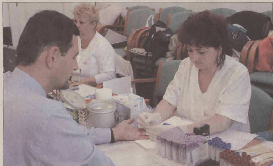
A véradás előtt mindenki átesett a kötelező orvosi vizsgálaton

Bár a figyelem kevésbé hullott a polgármesteri hivatal köztisztviselőire, egy kis létszámú csapattal ők is képviseltették magukat. Dr. Nagy Gábor Tamás polgármesterre negyed három körül került sor. Ezúttal nem mondott köszöntőt, sem ünnepi beszédet, hanem túljutva az előzetes orvosi vizsgálaton, maga is véradásra jelentkezett. Munkatársunk a vérvétel utáni kötelező pihenőidőben kérdezte a jelen akcióról, és a kerületben működő rádiócsatornával való együttműködésről.