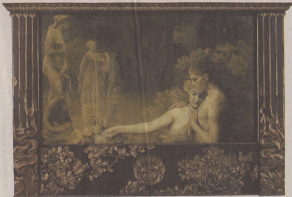
Vaszary János: Aranykor

A tárlat - amelyhez múzeumpedagógiai foglalkozásokat magukban foglaló családi hétvégek kapcsolódnak - 2008. február 10-ig tekinthető meg a Nemzeti Galériában. R.A.