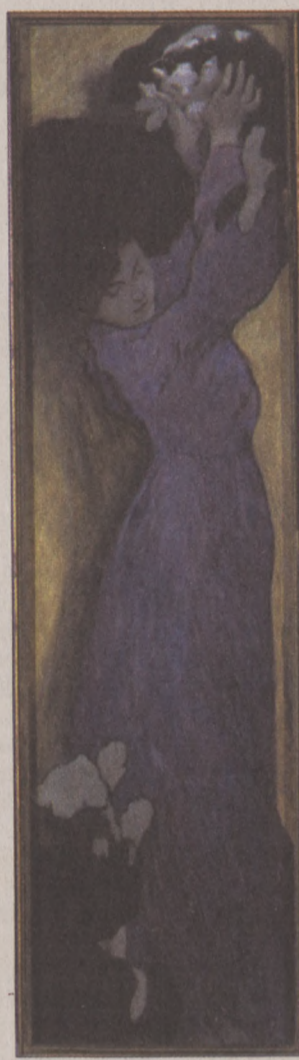
Vaszary János: Nő macskával

A kaposvári születésű fiatalember a kolozsvári piarista gimnáziumban érettségizett, majd Székely Bertalan és Greguss János tanítványként végezte el a budapesti Mintarajziskolát. Családja nem ismeretlen a hazai kultúra barátai előtt. Unokatestvérei: Vaszary Piroska színésznő és Vaszary Gábor író az 1930-as, '40-es évek jó nevű művészei voltak. A festő alig múlt húsz éves, amikor beiratkozhatott a müncheni Akadémiára, ahonnan egyenesen a párizsi Julian Akadémiára vezetett az útja. Innen kísért el Rómába atyai nagybátyját, Vaszary Kolos hercegprímást. Tanulmányútján