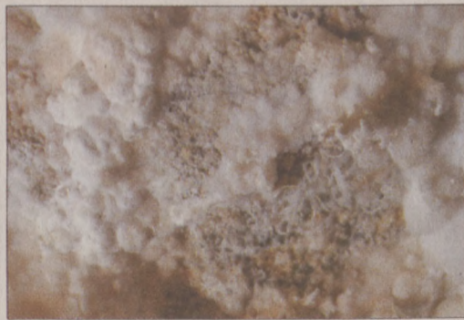
Páratlan természet kincseket rejt a Citadella kristálybarlang.

A decemberben 60,1 méter hosszan és 17,6 méter mélységig feltárt, hófehér ásványképződményekkel, rendkívül gazdagon díszített barlangot érintetlen állapotban találták a szakemberek. A kristályok sérülékenysége miatt ez a föld alatti világ a nagyközönség számára sohasem lesz bemutatható, de a jövőben is kutathatónak kell maradnia.