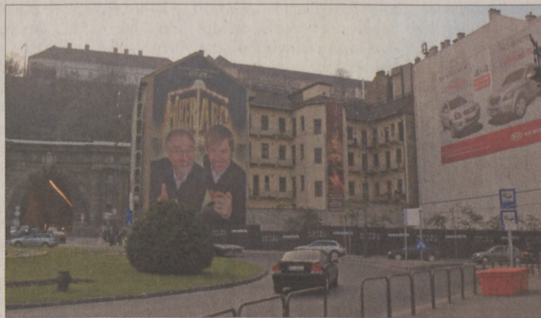
Erre az Alagút közelében levő Clark Ádám téri foghíj telekre épülne az ultramodern szálloda