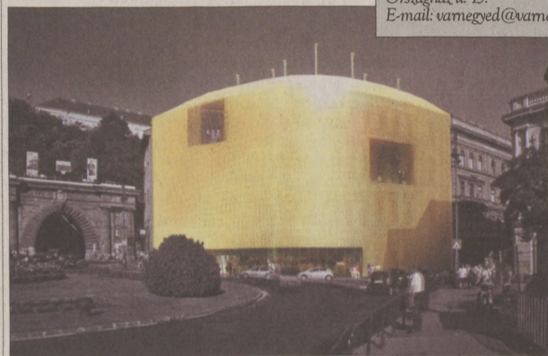
A díjazott pályamű látványterve. A külső héjat alkotó arany színű perforált lemez függönyként burkolja az épületet. A zsűri szerint a Világörökség részévé nyilvánított Duna-parti panorámba illeszkedik az épület

A tervező feladata Budapest egyik legforgalmasabb, városképileg legforgalmasabb pontján, olyan boutique hotel és étterem kialakítása volt, amely újszerű építészeti megfogalmazással figyelemfelkeltő, ugyanakkor illeszkedik a környezetébe – áll az Unione Clark Kft. pályázati kiírásában. Külső megjelenésével érzékelteti az épületen belül megtalálható korszerű technikát és modern belsőépítészeti. A szálloda szolgáltatásaival és stílusával a fiatal (25-49 éves), igényes, esztétikára és design-ra érzékeny vendégeket célozza meg. A belsőépítészeti design koncepciójában előírás volt, hogy a távol-keleti hangulat találkozzon a modern letisztultsággal.