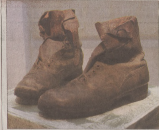
Schéner Mihály: Lábbelik

A kiállítás megtekinthető 2007. november 23-tól 2008. január 24-ig. Várnegyed Galéria, 1015 Budapest, Batthyány u. 67. Nyitva: kedd-szombat, 11.00-18.00