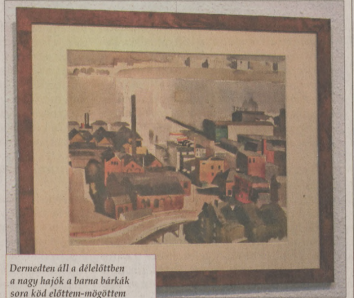
Dermedten áll a délelőttben a nagy hajók a barna bárkák sora köd előttem-mögöttem ahogy várost egy óriás lát

A megnyitót Györfi Gergely muzsikájával, és Incze Ildikó színművész szavalatával zárult.