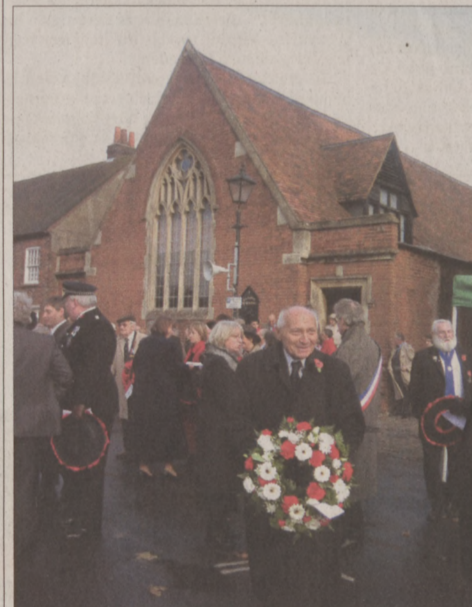
A Budavári Önkormányzat küldöttsége is részt vett az Emlékezés Napján tartott rendezvényeken