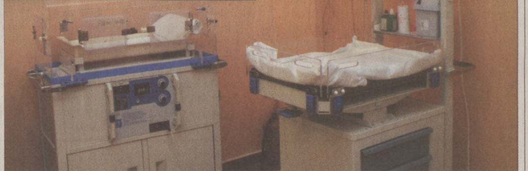
A koraszülöttek intenzív ellátására is alkalmas, jól felszerelt szobákat alakítottak ki a Szent János Kórházban