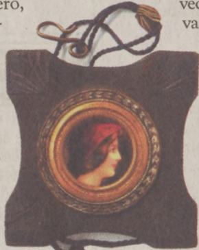
Magyar királyi állami Felső Építőiskola Táncestéje 1913. január 25.