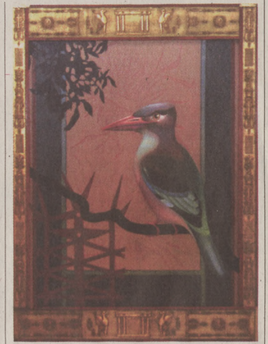
Szemadám György: Madárház