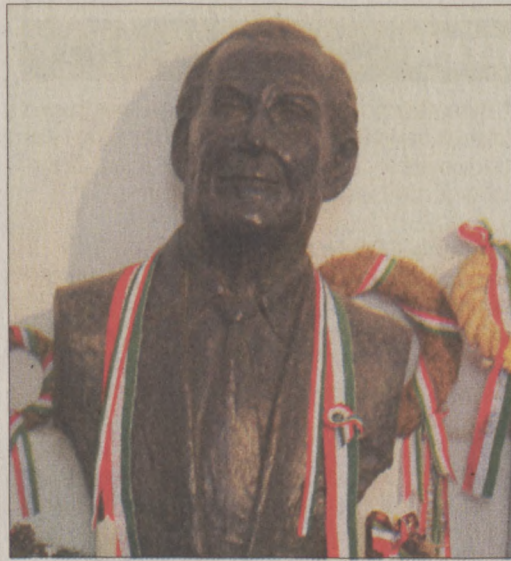
A talapzatról levett és a templomban menedékre lelt szobor Holtmaroson

A legnehezebb időkben is vállalta magyarságát és hitét. Regényeinek, novelláinak, verseinek sokaságában állított örök emléket a haláláig szere-