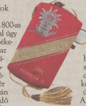
Turisták bálja 1904. február 13. Táncrend: Szünóra előtt: Csárdás, Keringő, Lengyelke, I. Négyes, Keringő, Csárdás Szünóra után: Csárdás, Pas de quatre, Keringő, II. Négyes, Tipegő, Csárdás