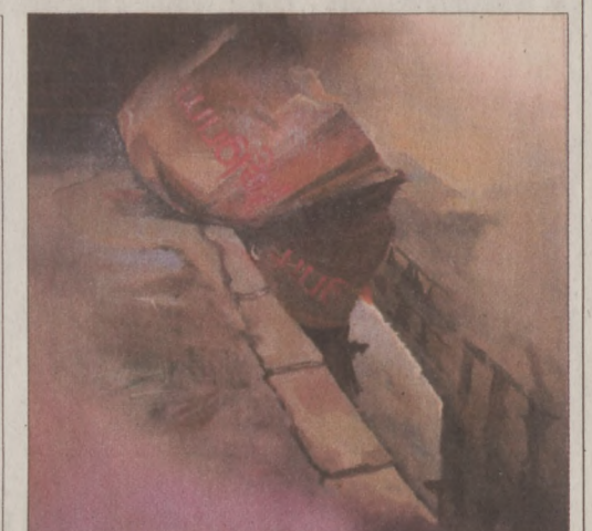
Kopek Rita: Eső

A kiállítás február 9-ig látható az Ostrom utca 29. szám alatt, keddtől péntekig 14 és 19 óra között, szombaton 11-től 19 óráig.