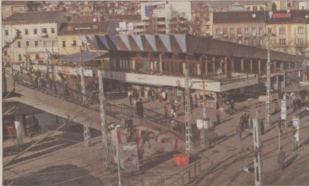
A Moszkva tér felújítása idén sem szerepel a kiemelt fejlesztések között

gusztusban pedig érkeznek az új Alstrom szerelvények a kettes metró vonalára – igaz utasokat csak 2009 februárjától szállítanak. Márciusra lezárul a Lukács, a Széchenyi és a Gellért fürdők felújításának második üteme, még ebben az évben megindul a Margit híd felújítása. A munkálatok első hónapjaiban várhatóan nem korlátozzák jelentősen a forgalmat. Folytatódik a négyes metró és a csepeli szennyvíztisztító építése, meghosszabbítják a 3-as és az 1-es villamos vonalát, utóbbi végállomása így Budára kerül. Végre rendeződhet a Csalogány utcai iskola és óvoda helyzete, az intézmény új épületet kap a San Marco utcában. 2008-ban ötven kilométernyi útszakasz újulhat meg, többek között új burkolatot kap a Hegyalja út is.