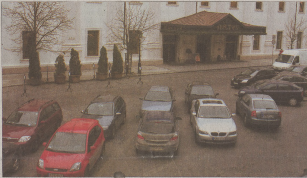
Áprilistól a Hiltonba érkező vendégek sem hajthatnak be a Várba

A képviselő-testület döntése nyomán, a vári állandó lakosok számára a behajtás és várakozás ingyenes. Kizárólag költségtérítést kell fizetni, amely 1500 forint. A lakosságon kívül behajtási és várakozási hozzájárulást csak azoknak a gazdálkodóknak tudunk kiadni, akiknek a telephelye, székelye, fióktelepe a védett övezetben található, saját tulajdonú gépjárművel rendelkeznek, és megfizették a gépjárműadó.