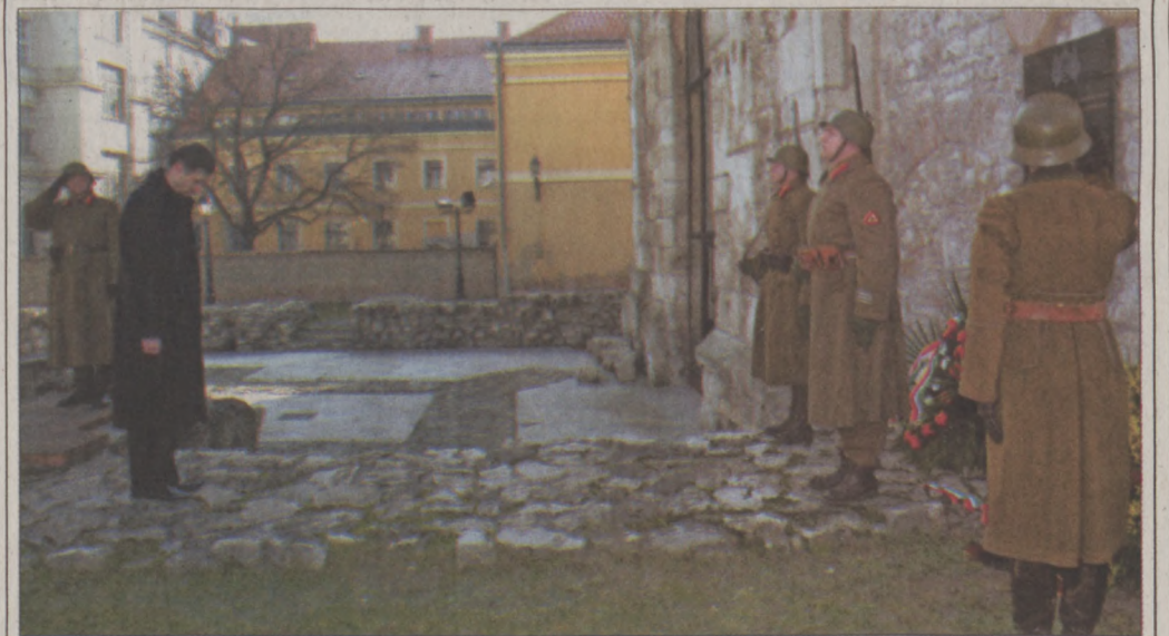
A Budavári Önkormányzat nevében dr. Nagy Gábor Tamás polgármester róttá le kegyeletét a Buda ostromában elesett katonák emléktáblájánál

Az emléktáblát 2005. február 12-én a budapesti közlekedésben hősi halált halt katonák emlékére állította a Budavári Önkormányzat és a Honvédelmi Minisztérium Hadtörténeli Intézete és Múzeuma.