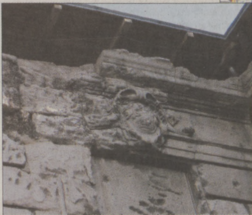
Az 1945-ös ostrom során súlyos károkat szenvedett az épület