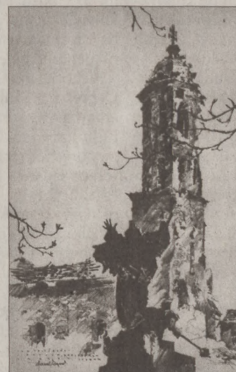
A Helyőrségi templom és a Kapisztrán szobor (Pflannl Egon rajza)

Arra már nem emlékszem pontosan, hogy másnap reggel vagy csak délután, de ijesztő csattanások, ropogások, súvító hangok hallatszottak, mint mondták, fegyverek, bombák, lövések zaja, s mi lemenekültünk a ház légoltalmi pincéjébe. Ez a légoltalmi pince a szenes pince folytatása volt, ahová engem eddig sohase vittek le. Most, mikor édesanyám kézen fogva levezetett ide, érdeklődéssel tekintettem körül, hiszen a ház lakóit többnyire ismertem, bár most mint valami felbolydult hangyaboly furcsán nyüzsögtek, minél „jobb”, kényelmesebb helyet igyekeztek találni a helyiségben. A tompa mormolás azonban rövid idő múlva elcsendesedett, a számomra hatalmasnak tűnő szürke vasajtókat sietve bezárták, az élénk világítás megszűnt, csak valami kékes fény derengett. Aztán hullámokban ránt tört valami eddig soha nem hallott iszonytató moraj, a ház falai szünet nélkül rázkódtak, a légoltalmi sziréna visított, az emberek összehúzódtak és egyesek imádkozni kezdtek. Nem tudom, meddig tartott, nekem borzasztó hosszú időnek tűnt, mikor - mint hallottam - lefújták a légi riadót, s a felnőttek bekapcsolva zseblámpáikat, visszabotorkáltak lakásaikba. A lépcsőházban törmelék volt mindenfelé, de azt hiszem, ekkor még nagyobb sérü-