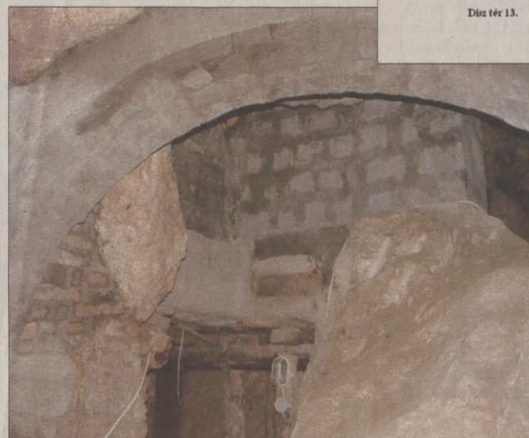
A kerület kizárásával a barlangoknak nincs gazdája

◆ Mennyire itéli veszélyesnek a jelenlegi állapotokat? - A barlangrendszerben ma már folyosók állnak víz alatt, és ezek nem természetes vizek. A támfalak és az úgynevezett főté (mennyezet) számos helyen omlik, hiszen a járatok folyamatos fenntartást igényelnének. Megoldásra vár a világítás és a szivattyútelep felügyeletének kérdése is, mert a kerület kizárásával ezeknek nincs gazdája.