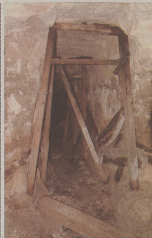
Korhadnak a több évtizede beépített dűcök

Három évvel ezelőtt a bíróság határozatban mondta ki, hogy a Labirintus valóban jogszertlenül tartózkodik a területen, ugyanakkor az önkormányzatnak nincs hatásköre a barlangrendszer védelmében fellépni. E döntés nyomán -