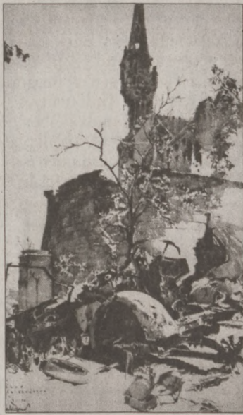
Az Esztergomi bástya és az Országos Levéltár romjai (Pflannl Egon rajza)

Korán sötétedett, a havas téli napon már késő délután megjött a Jézuska Attila utcai otthonunkba. Gondolom, nem csupán azért, mert két kisgyerek nagyon várta, hanem azért is, mivel háború volt, bár ezt eddig az estéig csak kevéssé éreztem. Igaz, édesapám, aki a Szent László fertőző kórház orvosa volt, az áprilisi angol-amerikai bombázások alkalmával súlyosan megsebesült, csupán egyedül maradt életben a kórház óvóhelyén, ami telitalálatot kapott. Ekkorra azonban már felépült, sőt dolgozni is tudott, az Attila utcai segélyhelyre osztották be orvosnak.