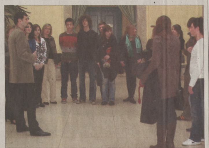
A diákcseréprogram keretében kerületünkbe érkezett diákokat dr. Nagy Gábor Tamás polgármester fogadta a Városházán

A diákokat és kísérőtanárokat dr. Nagy Gábor Tamás polgármester fogadta a Városháza aulájában, aki röviden felvázolta a gyermekek előtt a budai Vár és a kerület történelmét, kiemelve, hogy idén ünnepejük a Mátyás 550. évfordulóját. Ezt követően a kerület és Regensburg között meglévő intenzív testvérvárosi kapcsolatokról beszélt, hangsúlyozva, hogy nagyon sokat tanulhatunk egymástól. Nincsenek közöttünk határok, és egyre kevésbé lesznek nyelvi határok. Mindannyian uniós polgárok vagyunk – mutatott rá. Majd hozzátette: ahhoz, hogy valóban egy uniós polgárok közössége legyen, fontos a személyes kötődés, az iskolai évek, a cserediák-programok alatt létrejött barátságok, ismeretségek. – Soha többé ne