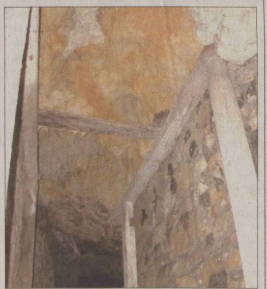
A mennyezet és a támfal számos helyen omlik

◆ Véleménye szerint, hogyan lehetne megőrizni és megvédeni a budavári barlangrendszert? - A Nemzeti Vagyongazdálkodási Tanácstól a számtalan leépítés és átalakítás miatt idő közben távoztak a korábbi, szakmailag jól informált szakemberek, és ez a tény mindenképpen leszűkíti a lehetőségeket. Úgy vélem, az alkalmi munkálatok helyett egy jól előkészített pályázattal – a Várhegy alatti üregrendszert a többi barlanggal komplexen kezelve – lehetne európai uniós forrásokat szerezni a szükséges állagmegóvó munkálatokra.