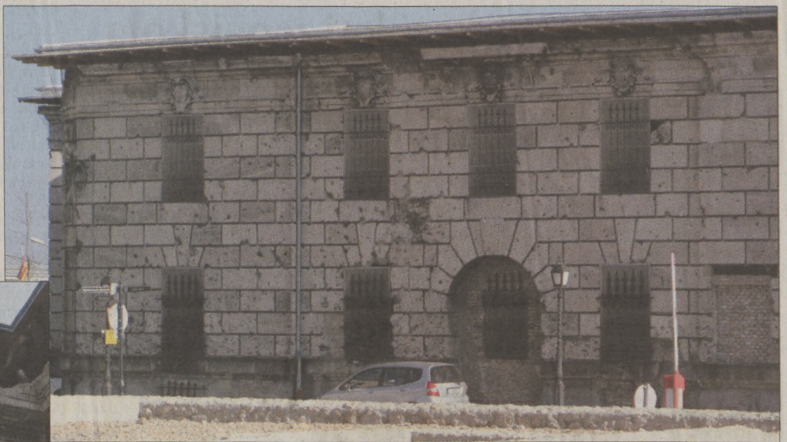
A Tervtanács elfogadta a terveket az egykori Honvéd Főparancsnokság átalakítására

A Dísz tér felé néző Honvéd Főparancsnokság impozáns kupolával díszített, eredetileg három emeletes neoreneszánsz épülete Kallina Mór – nevéhez fűződik a Budai Vigadó épülete is – tervei alapján 1896-ban készült el. Összekapcsolódva a szintén Kallina Mór munkáját dicsérető Honvédelmi Minisztériummal, a létrejött épületegyüttes az akkori kormányzati negyed egyik hangsúlyos elemévé vált. Mint szinte valamennyi újkori épület, a főparancsnokság is őrzi a régmúlt emlékeit. A telken már a középkorban épületek álltak, ezek maradvá-