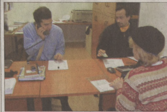
Az Iskola utca 16. szám alatti Irodában is várják a környéken lakókat a Polgármesteri Hivatal munkatársai

Hétfő: 8-18.30 óráig, kedd: 8-16.00 óráig, szerda: 8-16.30 óráig, csütörtök: 8-16.00 óráig, péntek: 8-13.00 óráig