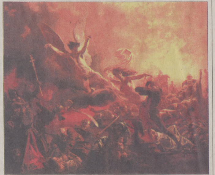
Zichy Mihály: A rombolás géniusának diadala

A Nemzeti Galéria a festményt az 1990-es években a művész zalai múzeumában helyezte