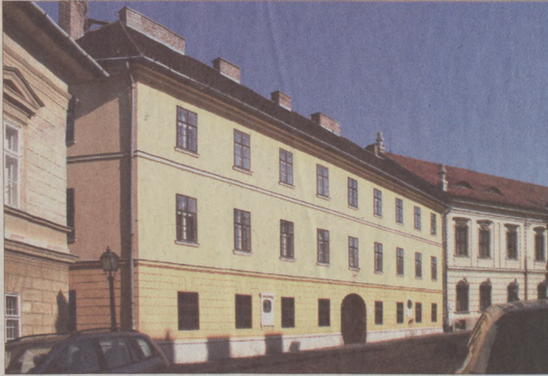
A Táncsics-börtönt rejtő épületegyüttes és a hozzá tartozó mintegy ezerhatszáz négyzetméteres telek a II. világháborút követően jóvátétel címén került amerikai tulajdonba. Itt oldották meg a Budapesten szolgáló tengerészgyalogosok elhelyezését, míg az egyik emeleten tornatermet rendeztek be. A kertet ünnepek megrendezésére használták.

Mint korábban megírtuk, 2006 októberében Göncz Kinga külügyminiszter és April Foley budapesti amerikai nagykövet írta alá a Tán-