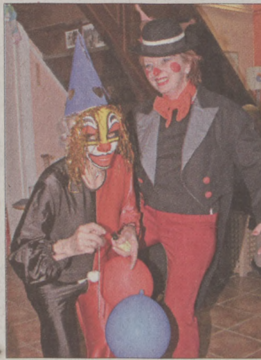
A nap fénypontja a jelmezbál volt

Az uszonnát követően a Fő utcai klub lassan táncteremmel alakult. Lapunk szemtanúi jelentették, hogy