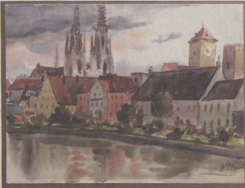
(Folytatás az 1. oldalról)

A galériában a teljes Zichy-életmű bemutatásának igényével, a hazai köz- és magángyűjteményekből is jelentős válogatás kerül a látogatók elé. A kiállítás március 23-ig tekinthető meg a C épületben és a főépület lépcsőfeljárójában.