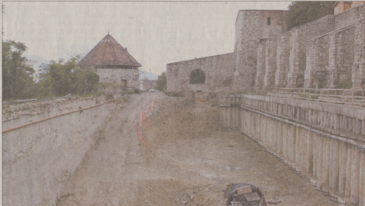
Megóvják a műemlék várfalat a Várgarázs építőtől