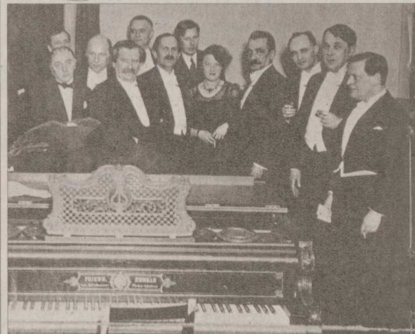
A Nyugat 25 éves jubileumán a Zeneakadémia. Balról: Szép Ernő, (mögötte) Erdélyi József, Gellért Oszkár, Móricz Zsigmond, Laczkó Géza, Babits Mihály, Tóth Aladár, Török Sophie, Schöplín Aladár, Füst Milán, Kosztolányi Dezső és Karinthy Frigyes