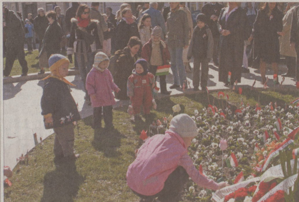
Ünnepelő családok március 15-én a Dísz téren