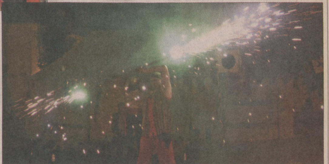
A cseh lovagok esti tűzparádéja

A köszöntő után az ifjú pár a népszépe élén a terített asztalokhoz vonult, és megkezdődött az esti tartó lakoma és vigalom. Szabó Csilla dallal lepte meg a vendégeket, majd a Tabulatúra együtt-