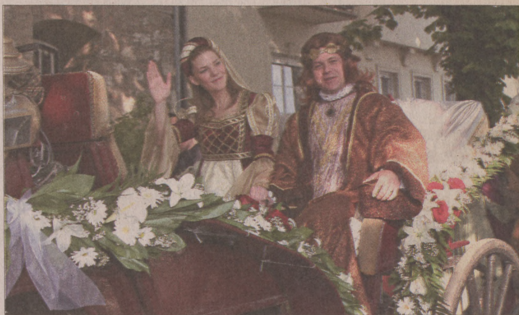
Mátyás király és Podjebrád Katalin menyegzőjének meglevenítésével vette kezdetét a mulatság