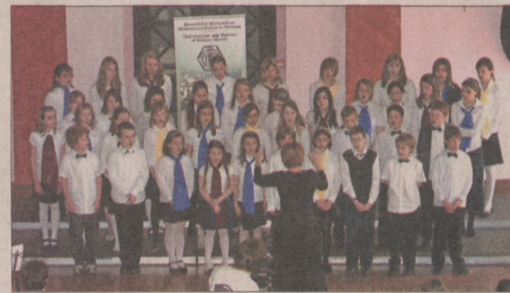
A Lisznyai utcai Általános Iskola kórusa

A Mátyás 550 rendezvénysorozat keretében Reneszánsz Kórus- és Hangszeres Találkozót szervezett az emlékvé ifjúsági programjait koordináló Szilágyi Erzsébet Gimnázium a Hadtörténelmi Múzeumban, a Budavári Önkormányzat támogatásával.