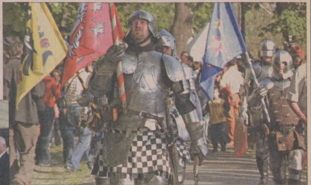
Dallás vitézek, lovagi tornák idézték fel a középkori hangulatot