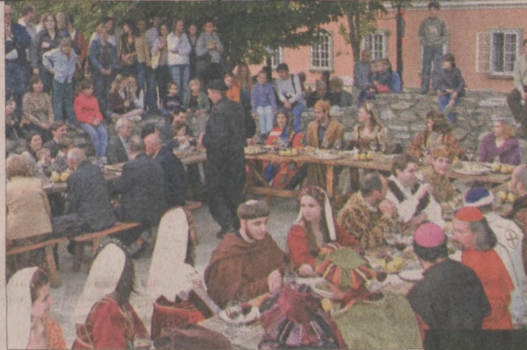
Királyi lakoma a Kapisztrán téren

Soha nem haszontalan a visszatekintés, ha a múlt tükrében meglátjuk saját életünk reményét. Meglátjuk, hogy Mátyás templomát ugyan szinte minden nemzedéknek újra kellett építenie, de az itt élőknek mindig elég hite volt ahhoz, hogy újra és újra felépítse a falakat. Meglátjuk, hogy Mária országa, amelyre Corvin Mátyás hitet tett - léte-