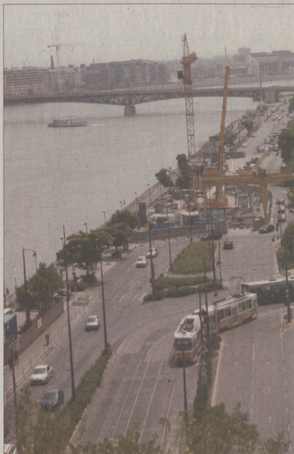
Június 2-ától év végéig nem lehet közlekedni a budai alsó rakparton a Lágymányosi híd és az Erzsébet híd között, mert az épülő budai Duna-parti fogyújtócsatorna kivitelezője további részeket zár le a rakparton a munka folytatásához.