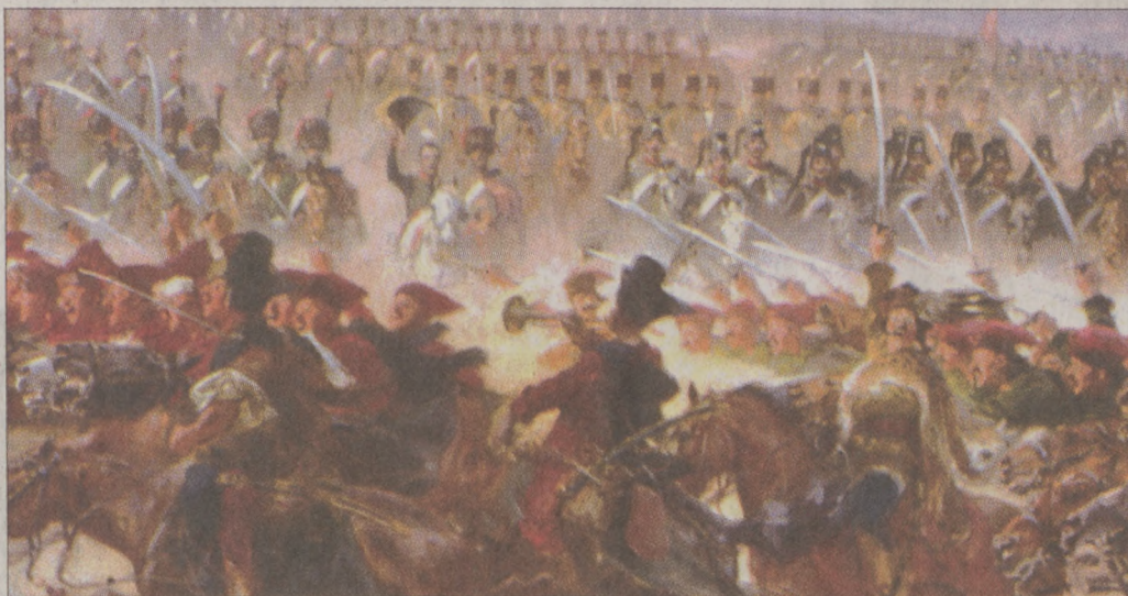
Részlet A huszárság diadalútja című óriáspannóból (Grand Prix, 1900 Párizs)

A mestert vonzotta a monumentalitás. Képoriásain a tömegjelenetek megannyi miniatúr portréként jelennek meg, lovassapátok vonulnak át a színen és minden epizódnak önálló jelentése van. Legismertebb munkája - A huszárság diadalútja - az 1900-as Párizsi Világkiállítás magyar pavilonját díszítette. A 18 méter hosszú és 3,5 méter magas pannó az európai könnyű lovasság 400 éves történetét vonultatja fel. Két magyar huszár álmából kerekedik ki a festmény hatalmas víziója, amelyen az európai huszárság valamennyi változata megtalálható. A képen, ott szerepel számos jelentős történelmi figura, - közöttük Napóleon is, akit egy anekdota szerint Vágó Pál a trianoni