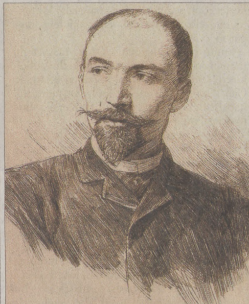
A művész önarcképe