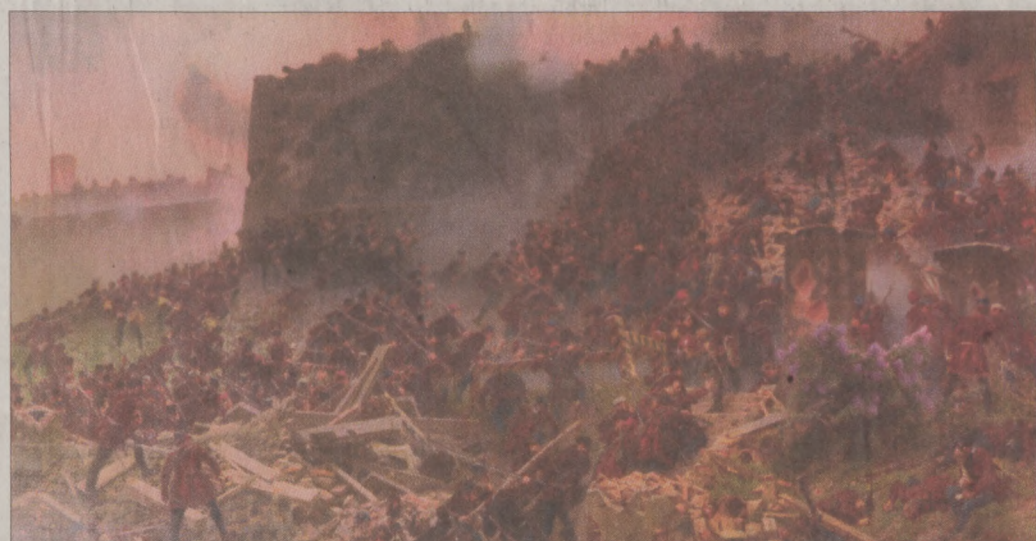
A Budavár bevétel 1849. május 21. címet viselő fallkép a Nemzeti Galéria tulajdonaként 1998-ban - éppen egy évtizede - került a Polgármesteri Hivatal aulájába. A képet a szabadságharc 150-edik évfordulója tiszteletére restaurálták. (Részlet)

májában, majd azt megnyerve véglegesítette a képet nagy méretben. A témával már 1907-ben foglalkozott, s egy leveléből kiderül, hogy a témát a nagy elődökhöz képest modernebb felfogásban és nagyobb drámai erővel kívánta megjeleníteni: „Budavár bevételét, ezt a par excellence magyar hazafias témát, csak a legnagyobb naturalizmussal, természetihűséggel „szabad” megalkotni, és nem szabad a drámai verizmust a stilizálásnak feláldozni.” A képen Vágó szerialitása következtében tökéletesen érvényesül mindkét elv, a hősi halálig tartó drámai küzdelem részletekben is gazdag megjelenítése, amely az ostromhoz illő hangulat- és természetábrázolással párosul. Összhatásában a magyar történelmi festészet egyik leghatásosabb, legmonumentálisabb, legdrámaibb művét alkotja. (részlet)