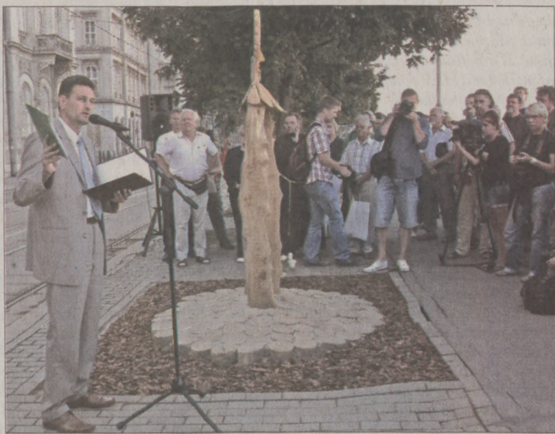
Emlékfát állítottatta a Budavári Önkormányzat a 2006. augusztus 20-i vihar áldozatainak emlékére

A két évvel ezelőtti, augusztus 20-i tragikus vihar áldozatainak emlékére egy emlékfát avattak a Budavári Önkormányzat a Duna-parton. Az emlékművet annak a kidőlt fának a helyén állították fel, amely két ember halálát okozta.