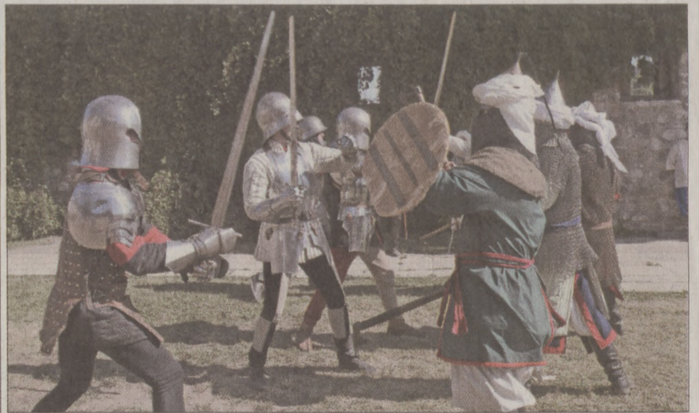
Az Újvilág-kertben történelmi játszótér és a hagyományörzők bemutatója idézte fel a dicsőséges időszakot

A rendezvény a Várörsg Alapítvány, a Sárkányos Lovagrend szervezésében, a Honvédelmi Minisztérium - Hadtörténelmi Intézet és Múzeum közreműködésével, továbbá a Budavári Önkormányzat és a Budavári Vagyongazdálkodási és Innovációs Kht. támogatásával jött létre. A hagyományörző bemutatókon a Bornemisza János Hagományörző Egyesület, a Mathias Rex Történelmi Hagományörző Egyesület, a