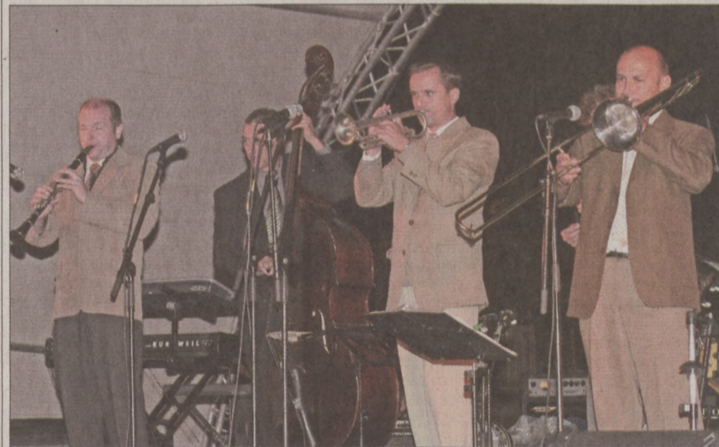
A Hot Jazz Band nagy sikerrel idézte fel az 1900-as évek hangzásvilágát

◆ A korszak énekhang mögött mennyire ügvelnek a korszak hangszereire és színpadi megjelenésre?