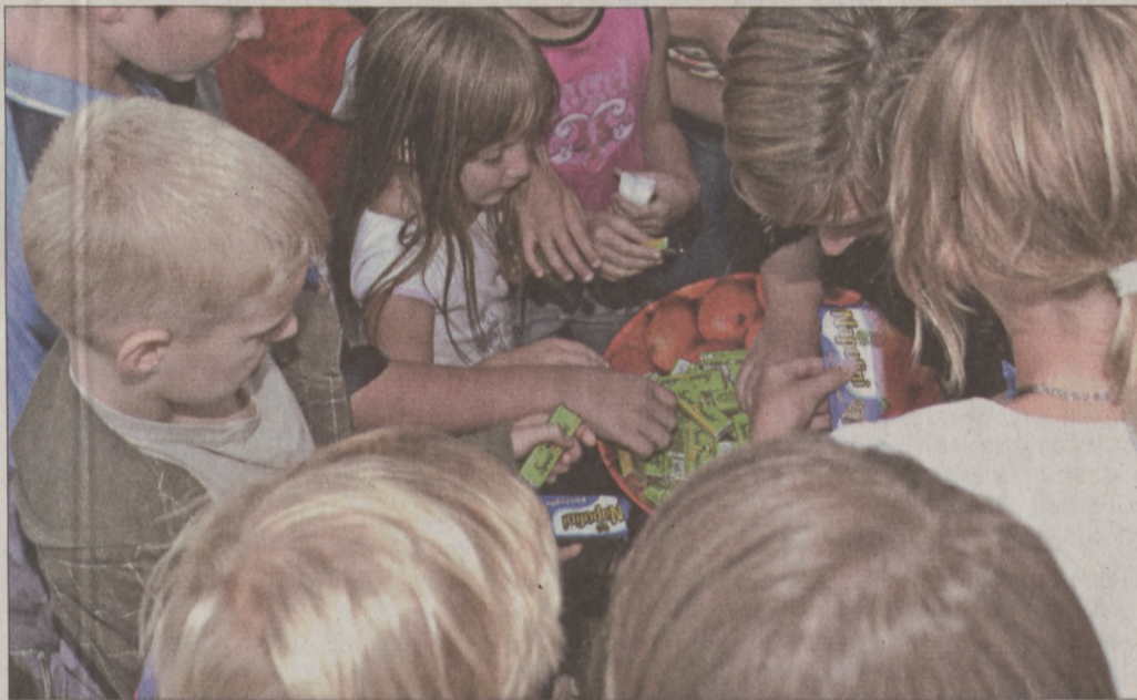
A gyermektáncverseny résztvevői mindannyian kaptak jutalmat

koreográfiákat: a baba-mama kettősöket, a legkisebbek totyogós lépéseit és a nagyobbakat, aki közül néhányan fellépést is vállalhatnak. A harmadik körben megszületett a döntés: minden indulónak jár a jutalom; a versenyt követően ily módon több tucat ajándék-csokoládé és -jégkrém talált gazdára.