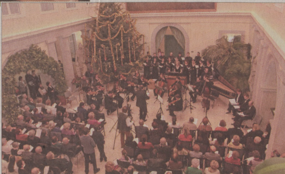
A Purcell kórus és az Orfeo zenekar adott adventi koncertet a Városházán