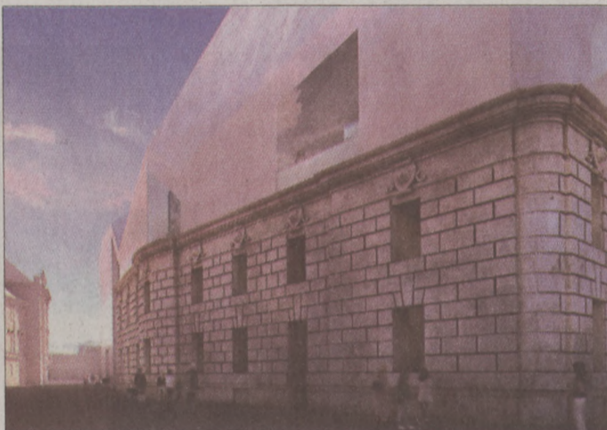
Nézet a Dísz tér felől a Színház utca irányába (látványterv)

kiadni nem lehet, meghiúsulnak a kormány szándékai. Mivel a kormánynak nem csak joga, hanem kötelessége is felhasználni az uniós támogatásokat, s úgy tűnik, hogy a vári rekonstrukcióra szánt pénz 2010 végéig nem használható fel, a kormány kénytelen lesz a projektre elkülönített 11 milliárd forintot más gazdasági célokra átcsoportosítani. „Úgy tűnik, hogy Budavára esik