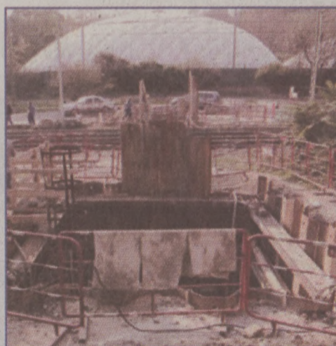
Elkészült a Tabánban az Ördögárok megcsapoló csatornája

hogy a talajt ne kelljen a csatorna teljes hosszában megbontani. A csöveket egymás után besajtolták a talajba, így a csatorna a földfelszín alatt épült meg. Ezért a kivitelezéshez csak nagyméretű aknákat kellett kiépíteni a Tabánban, a talajt pedig csak rövidebb szakaszokon kellett felbontani. Mára ez a mellécsatorna megépült, most összekötik a felső rakparton újonnan épülő fogyűjtőcsatornával. A Döbrentei téren szintén az Ördögárok megcsapolásához kapcsolódó munkák zajlanak, előreláthatóan jövő májusig.