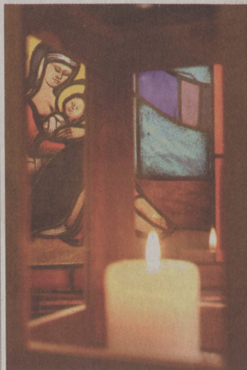
A Szeretet Lángja a Duna Televízió előcsarnokában

Ismét eltelt egy esztendő. Ismét Karácsony van, és ez minden hátravetetés ellenére bizalommal tölti el az embert, bizalommal önmaga és a másik ember irányába. Idén adventkor a betlehemi Születés Templomából indult útjára a Szeretet és Összetartozás Lángja, amely nálunk, Budavárában is hirdeti a hitet, a reményt és az együtté tartozást. Bizony, ma, amikor egyre gyakrabban vagyunk, és egyre inkább elveszítjük a másokba vetett bizalmunkat, szükségünk van arra, hogy megértsük a Szeretet Lángjának üzenetét: ahogyan a fény utat nyit a sötétségben, úgy kell a szívünket kinyitni a másik ember felé. Azt üzeni a számunkra: reménykedhetünk a megújulásban, bizakodhatunk a cél elérésében, a többé válás lehetőségében. Hiszen, ha jól belegondolunk mindez a várva várt pillanat bekövetkeztére hívja fel a figyelmünket: arra, hogy a türelmes, állhatatos várakozás meghozza a gyümölcsét. A Karácsony ünnepe a Szeretet mindent