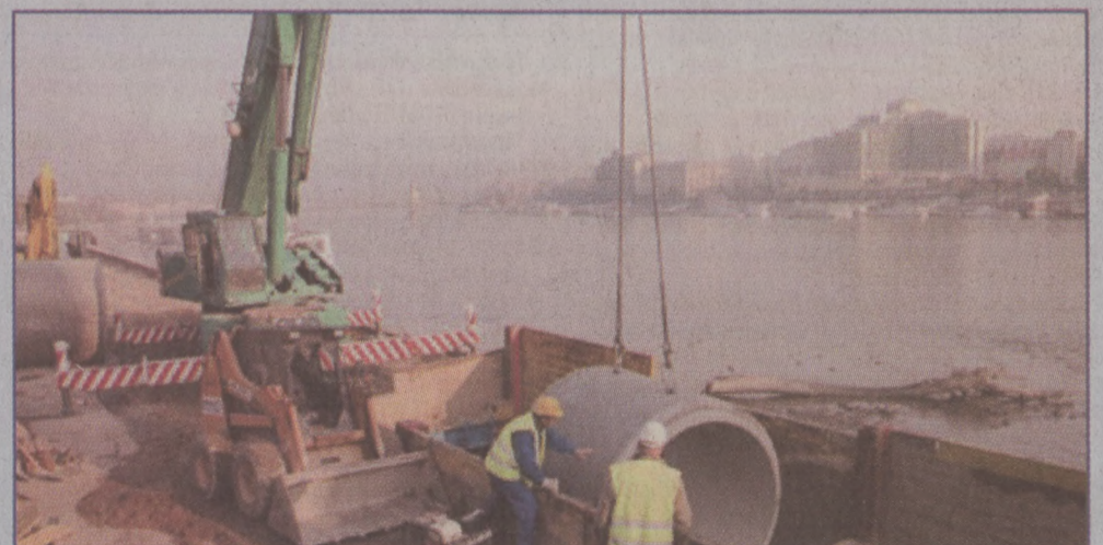
A Duna-parti fogyűjtőcsatorna építése az Erzsébet hídnál