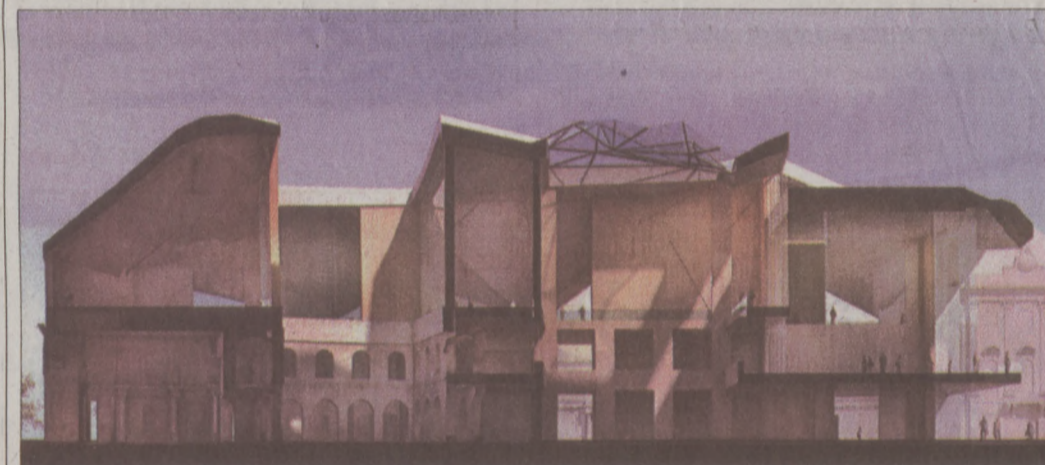
Az ötödik tervváltozat az épület rekonstrukciójára 2008. november (látványterv)