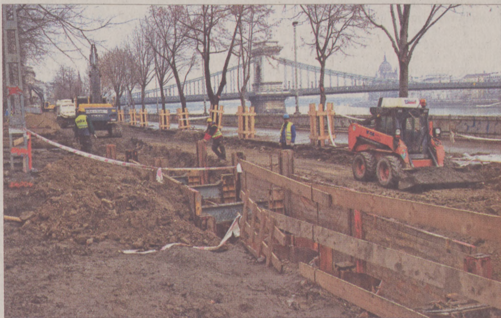
A csatornaépítés miatt két és fél hónapig módosul a forgalmi rend a Bem rakparton és a környező utcákban

A forgalmi rend átmeneti módosítására a Bem rakpartot, a Pala, a Halász és a Jégverem utcát érintő csatornaépítés miatt van szükség. A környéken zajló munkálatok első fázisában, előreláthatólag február 26 és március 5 között a Bem rakpart Halász és Pala utca közötti szakaszát lezárják, a Pala utcát szintén lezárják, a Jégverem utca pedig zsákutca lesz a Fő utca irányából. Második fázisban, várhatóan március 6 és 25 között a Bem rakpartot teljes szélességében lezárják a Pala utca és a Clark Ádám tér között. A rakpart ezen szakaszán lakók az addigra megnyitott Pala utcán keresztül juthatnak el otthonaikhoz, parkolni pedig a környező utcákban tudnak ez alatt a két hét alatt. Március végéig a Jégverem utca zsákutca