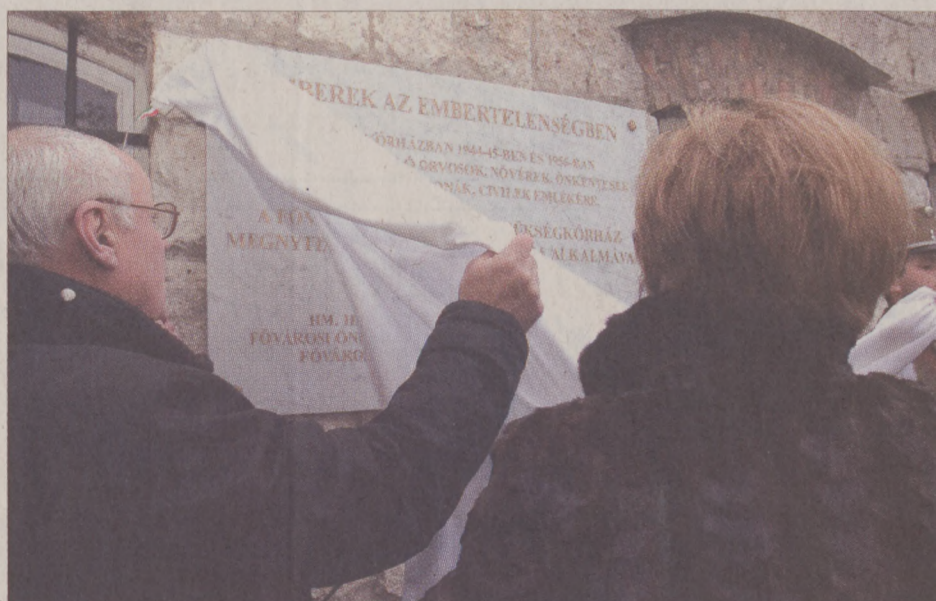
A Sziklakórház megnyitására 65. évfordulója alkalmából közösen avattak emléktáblát a működtetésében részt vett szervezetek az épület bejáratánál