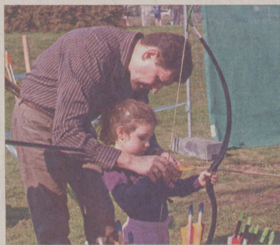
Tabán Spartacus SKE