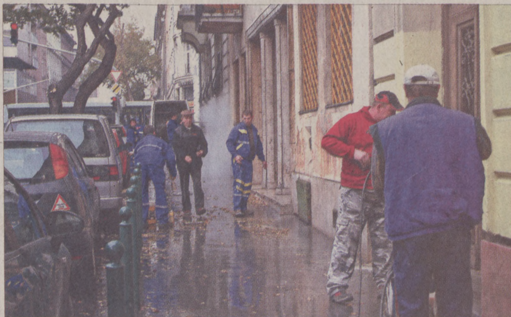
Sok krisztinavárosi utcában tisztították le az önkormányzat a falfirkákat az épületek homlokzatáról