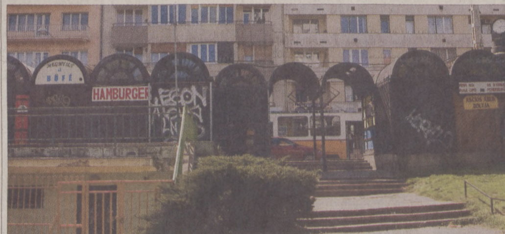
A főváros kezelésében levő Horváth-kert is megérett a felújításra

A polgármester említést tett a kerületi beruházásban történt útfelújításokról is: a Krisztinavárosban a Logodi utca, a Kosciuszko Tádé utca és a Lovas út újult meg egy-egy szakaszon. Az idej tervek között szerepel a Váralja utca Alagút utca - Dózsa György tér közötti szakaszának átépítése, a Fővárosi Vízművek vízvezeték hálózatának rekonstrukcióját követően. A Mikó utca átépítésének tervezése folyamatban van, a kivitelezést követően több autó parkolására nyílik majd lehetőség. A lépcsők közül legutóbb a Tűzserézs emlékmű melletti lépcsőt hozták helyre (Tábor utca - Logodi utca kereszteződésében), idén a Jávorka lépcső javítására kerül sor. A közbiztonság javítását a Pauler utcában korszerűsítették, ahol stíl kandelabereket helyeztek ki.