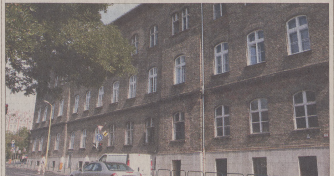
A Kosztolányi gimnáziumban épületszigetelésre és az ablakok cseréjére fordított jelentős összeget a kerület