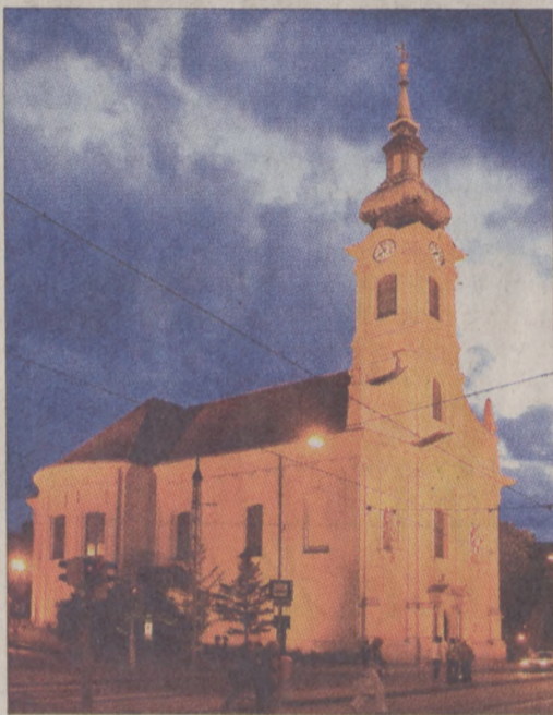
A Krisztina téri templom felújítását is támogatja az önkormányzat

Az önkormányzat első ütemben az egyik „legfertőzöttebb” területet, az Attila út Vérmező melletti szakaszát (az Attila út 81.-133. sz. épületeket) tisztította meg saját költségén, majd ezt követően az Attila út 1. – 80. közötti szakaszról is letakarította a firkákat.