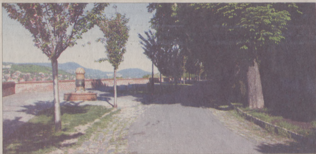
Megszépült a Tóth Árpád sétány Befejeződött a Tóth Árpád sétány parkrekonstrukciójának harmadik szakasza. Márciusban és áprilisban a sétány Móra Ferenc utca - Disz tér közötti szakaszát újították fel a Budavári Önkormányzat. A munkák során kicserélték a padok alatti, mára kikoptott burkolatot, új utcabútorokat helyeztek ki és megújult a zöldfelület is. Díszeseresnyefákat ültettek, parkosították és virágosították a közkedvelt sétányon. A 16 millió forint értékű felújítással a Föld Napjára készültek el a kivitelezők.