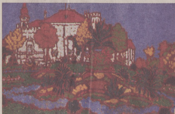
Rippl-Rónai József: A geszti kastély

Szűfrazsett-mozgalom, élő közvetítések a telefonhírmondón keresztül, nagyvárosi kávéházi élet. A 20. században rövid időre Budapest utolérte Európát. Ez volt az 1900-1915 közötti másfél évtized, amely a különböző művészeti ágakban szakított a hivatalos stílussal, és megmutatta modern, alternatív arcát. A Magyar Nemzeti Galéria új időszaki kiállítása a száz esztendeje alakult Művészház nevű egyesületnek állított emléket.