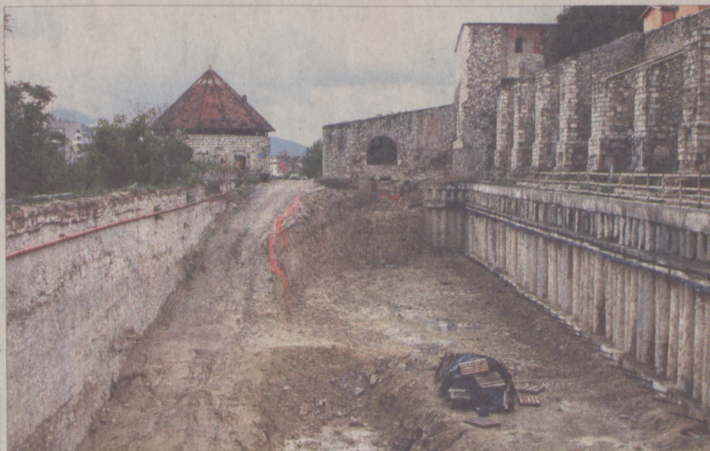
Legkorábban jövő őszre készülni el a várfal tövében épülő mélygarázs