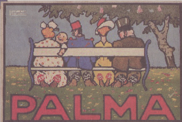
Bíró Mihály: Palma