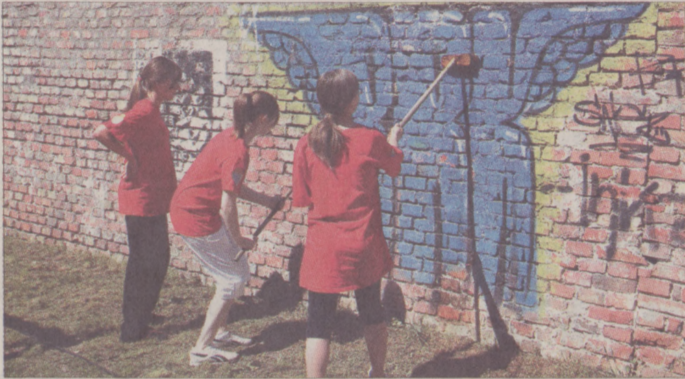
A Petőfi Sándor Gimnázium diákjai a falakat elcsúfító graffitiket mosták le

A Föld Napja programjaiból kapcsolódva évek óta városrészépítésre hívja a kerület lakóit a Budavári Önkormányzat. Idén a Váralja utcában az Alagút és a Sarló lépcső közötti területet tisztították meg a hulladékoktól és a falfirkaiktól. A Dózsa téri labdázóban graffitimentesítés zajlott, a kerületi fenntartású játszótereken pedig a szülők bevonásával a csikkeket szedték össze. A Petőfi Sándor Gimnázium diákjainak köszönhetően egyebek mellett a Horváth-kert rendbe tétele. A Hilton munkatársai a Halászbástya környékét tisztították meg.