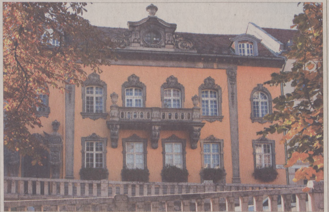
Helyi védelem alá helyezték többek között a Corvin tér 11. szám alatti épületet is