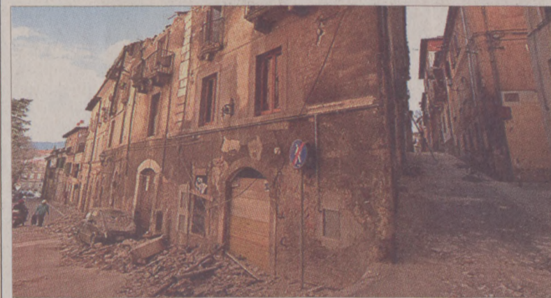
A Budavári Önkormányzat is segíti a földrengés-sújtotta capestranói műemlékek helyreállítását

A kapcsolatot az Olaszországban élő egykori '56-os menekültek mellett a Rómában működő két magyar külképviselet, a budapesti Hadtörténeti Intézet és Múzeum, valamint a Capestranóval testvérvárosi kapcsolatra lépett Budavári Önkormányzat gondozza.