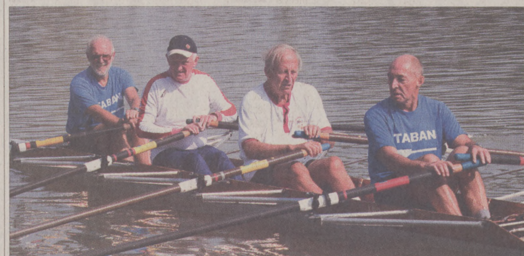
Az újjáalakult Tabáni Evezősklub tiszteletére hívta életre a dunai regattát a Tabán Társaság