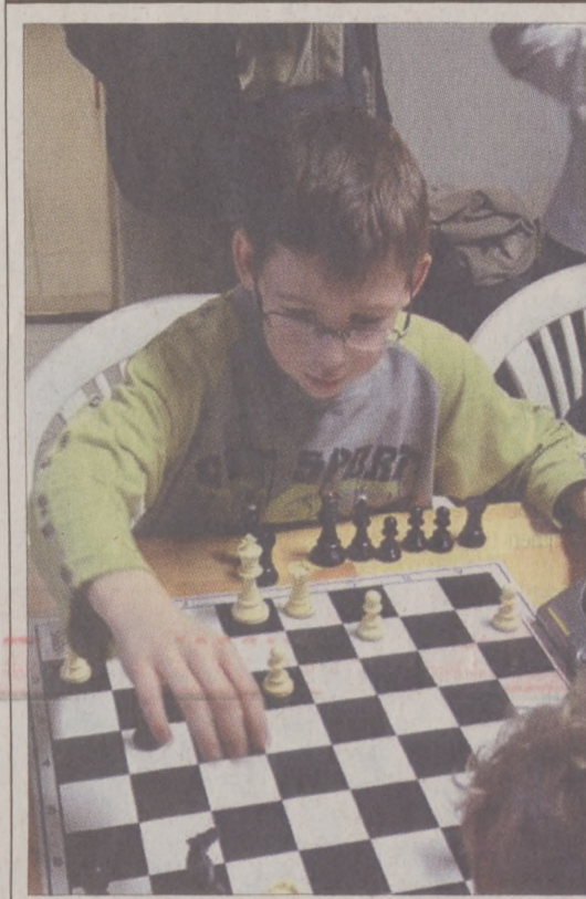
A Czakov utcai Sport- és Szabadidőközpontban rendezték meg a kerületi diákolimpia sakk versenyt. A megmérettetésen négy intézmény - a Lisznyai Általános Iskola, a Budavári Általános Iskola, továbbá az Egyetemi Katolikus Gimnázium és a Petőfi Gimnázium képviseltette magát hat korcsoportban, közel ötven résztvevővel.

Az épület, illetve a lakók biztonsága érdekében műszaki ok vagy rendkívüli esemény fennállása esetén a lakásban tartózkodó köteles beengedni a közös képviselőt vagy meghatalmazottját. Az eddigiekhez képest némi többlet kiadást jelent a társasházak számára, hogy ötven albertét, illetve tízmilliósi bevétel felett kötelező a számvizsgáló bizottság munkáját segítő mérlegképes könyvelőt alkalmazni.