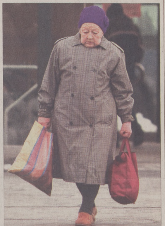
Egyre nehezebb a megélhetés

A Budai Idősügyi Tanácsok Konferenciájának résztvevői szerint mára megszűnt a nyugellátások biztonsága, a nyugdíj előtt állók nem tudják, mi-