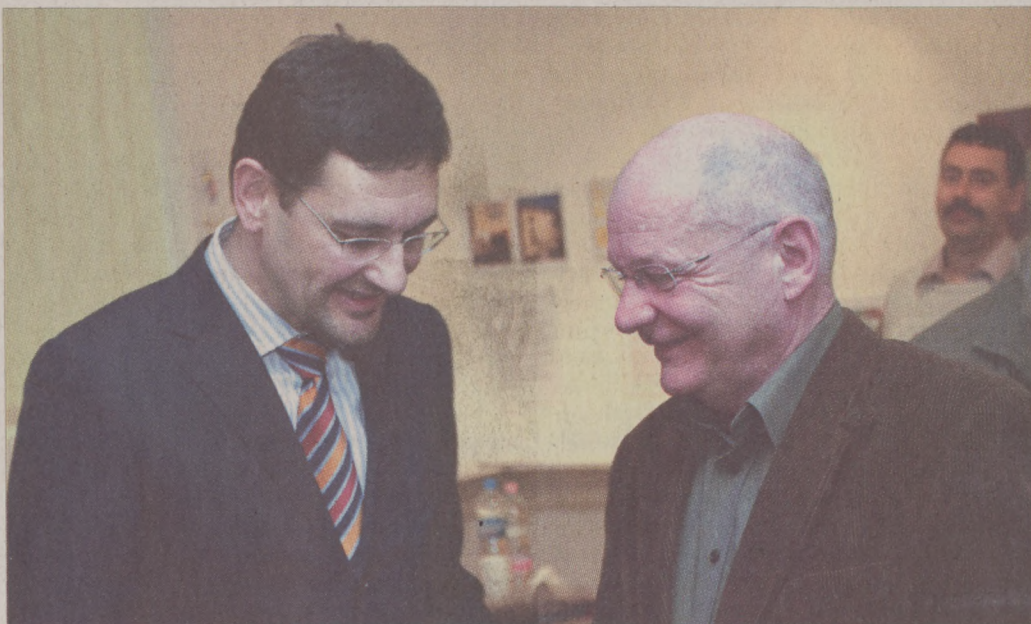
Dr. Nagy Gábor Tamás polgármester és Bereményi Géza a kiállításon

A pályázat február végi eredményhirdetése előtt az itt megfogalmazott véleményeket is értékelni fogja a bírálóbizottság. Nem lesz könnyű dönteni – mondta a tervekben rendezett kiállítás megnyitóján dr. Nagy Gábor Tamás polgármester, akit lenyűgözött az alkotások bősége és sokszínűsége. Mint fogalmazott, Cseh Tamás dalai most is itt élnek a lelkünkben, ezért is gondolkodtak el róluk olyan sokan és fejezték ki érzéseiket különleges elképzelések formájában.