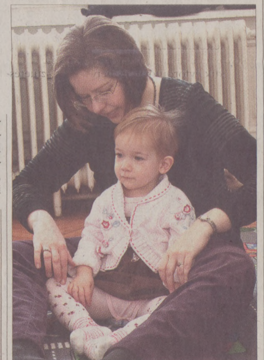
Népszerűek a baba-mama foglalkozások

időpontot is foglalhatnak, vagy okmányokat tölthetnek le, esetleg elolvashatják a Várnegyed újság archív számait. A jelentkezők többsége azért jön a tanfolyamra, mert számítógép vásárláson gondolkodik, amit atól tesz függővé, hogy sikerül-e megtanulnia az alapokat. Sokan vannak olyanok is, akik családi okokból iratkoznak be, mert abban bíznak, hogy távol élő rokonaikkal szorosabb kapcsolatot tudnak fenntartani az interneten keresztül. Annak is érdemes eljönni, aki nem rendelkezik komputerrel, ugyanis az Idősek Klubjában, illetve a művelődési házban is ingyenesen lehet használni a számítógépeket.