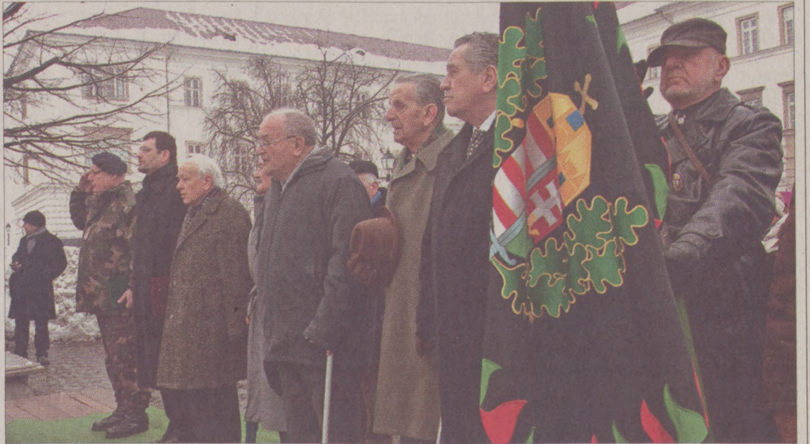
A Kapisztrán téren hagyományörző katonai tiszteletadással emlékeztek a budapesti ostrom áldozataira

Másnap a Budavári Művelődési Ház szervezésében a Boldog Batthyány-Strattmann László Idősek Akadémiája Irka Körének tagjainak közreműködésével emlékeztek Budapest ostromára