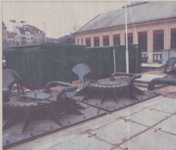
A fővárosban termelő szennyvíz kilencvenöt százaléka, és a csatornahálózatba kerülő víz száz százaléka biológiai tisztítást követően juthat a Dunába

A teljes hálózat tesztüzeme július 31-én lezárul, eddig kell elkészülniük a kiegészítő beruházásoknak is. Ilyen a Döbrentei tér közelében, a Rudas fürdőnél megkezdett csapadékvíz elvezető csatornák megépítése. A munkálatok idején forgalomtechnikai változásokat vezetnek be a fürdőnél, a Gellért hegy felőli oldalon a 2x2 sávú út 2x1 sávúra szűkül, valamint parkolási tilalom lép életbe. A fürdőnél délre található jelzőlámpás kereszteződésben megcserelelték az autós és a buszszávjat. Továbbra is megmarad a jobbra kanyarodási tilalom a Szent Gellért rakparton északi irányból érkezők számára az Erzsébet híd irányába, a dél felé haladó autósoknak viszont már nem kell a villamossíneknek közlekedniük. A korlátozások várhatóan március végéig maradnak érvényben. A csatorna átépítés eredményeként elkülönül egymástól a Rudas fürdő szennyvíze, valamint a környezetre ártalmatlan fürdővíz és csapadékvíz. Utóbbiak továbbra is a Dunába folynak, a szennyvíz viszont a budai Duna-parti főgyűjtőcsatornába kerül.