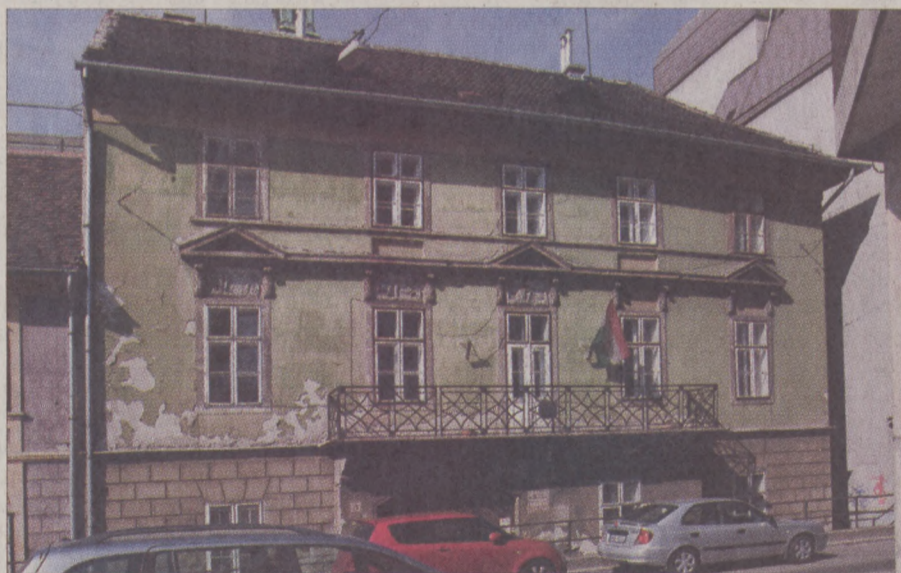
Rövidesen megkezdődik a Döbrentei utca 15. szám alatti épület teljes felújítása