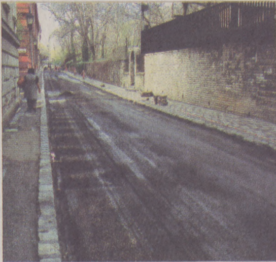
A Váralja utca felújítás előtt...

A tervezettnél korábban fejeződött be a Váralja utca rekonstrukciója. A mintegy 325 méteres útszakaszon a kopórteleg cseréje és az út alap megerősítése mellett, a gyalogjárdát is felújították. Nyáron újabb útépités kezdődik, a Roham utca teljes felújítása három ütemben valósul meg.