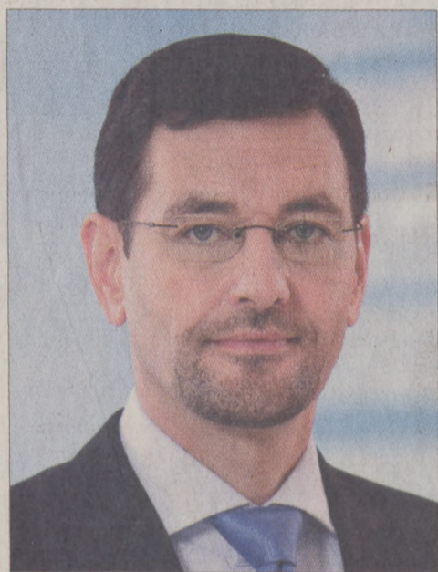
Dr. Nagy Gábor Tamás immár a 4. ciklusban képviseli az I. kerület és a II. kerület egy részének lakóit a Parlamentben

A 2010. április 11-én megtartott országgyűlési választás első fordulójára Budapest I. számú választókerületében érvényes és eredményes volt. A választópolgárok által leadott szavazatok 53,33 százalékát dr. Nagy Gábor Tamás a Fidesz-KDNP képviselőjelöltje kapta, s ezzel már az első fordulóban mandátumot szerzett. Ezért második fordulóra az I. számú választókerületben nem kerül sor. (Választási tájékoztató a 2. oldalon.)