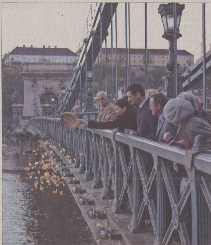
A Lánchídról a séta résztvevői virágokat szórtak a vízbe a „legnagyobb magyarra” emlékezve

A Várnegyed Galériában Széchenyi-emlékkiállítás nyílt, amely május 15-ig tekinthető meg (Budapest, I., Batthyány utca 67.). - d -