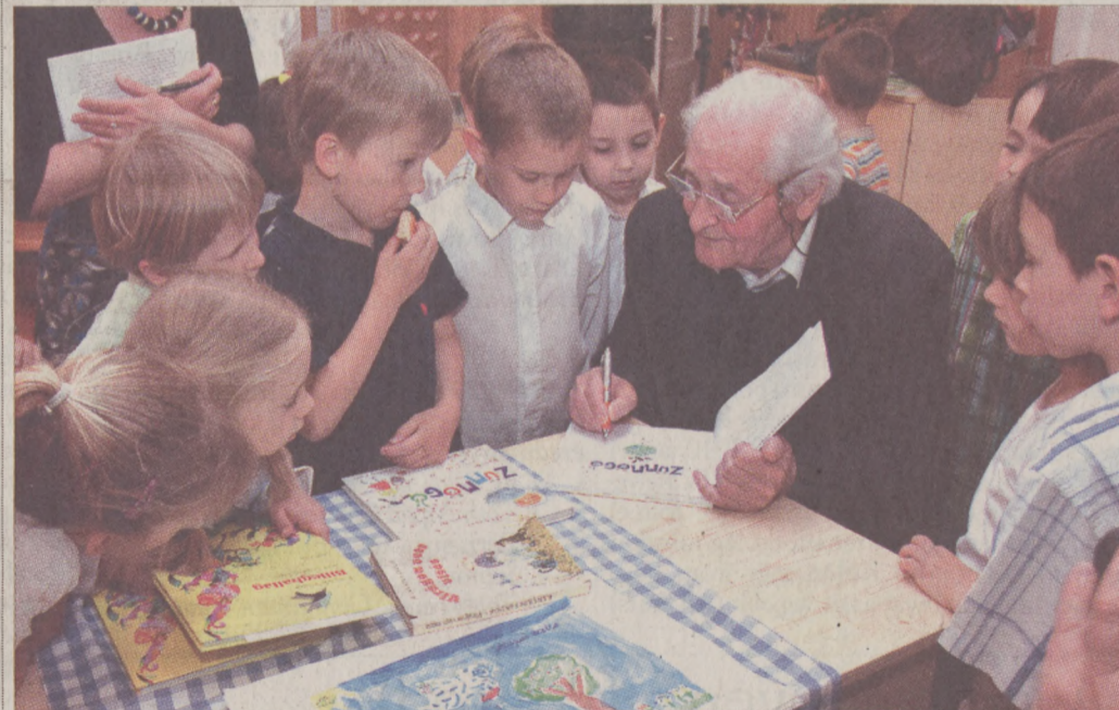
Az Iskola utcai óvodások Kányádi Sándor költőtől tanulhattak verseket

veget is visszamondani. A következő tanulnivaló, ugyanis a Reménytelenül című József Attila vers egyik strófája volt, amiről a költő elmondta, hogy fiatal korában egyszer már megpróbálta gyerekeknek ajánlani a szöveget. Akkoriban azonban