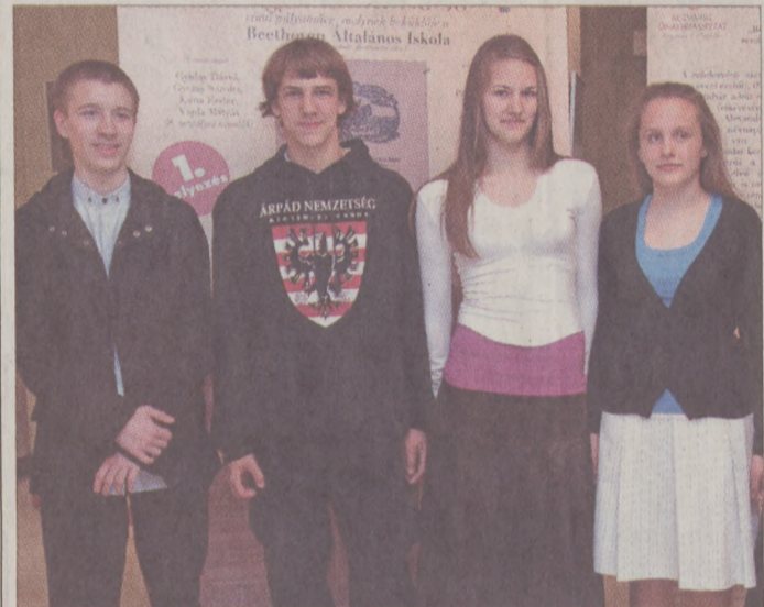
A győztes csapat

A legszínvonalasabb lapokat készítő csapatok május 8-án a Magyar Kultúra Alapítvány székházában rendezett országos döntőn, az előzetesen közzétett ajánlott irodalom ismeretanyagára építő feladatokban mérhették össze tudásukat. A széleskörű tájékozottságot megkövetelő vetélkedőn résztvevő öt csapat kivétel nélkül kiválóan teljesített – az eredményhirdetésen mindannyian díszereket kaptak a zsűri tagjaitól.