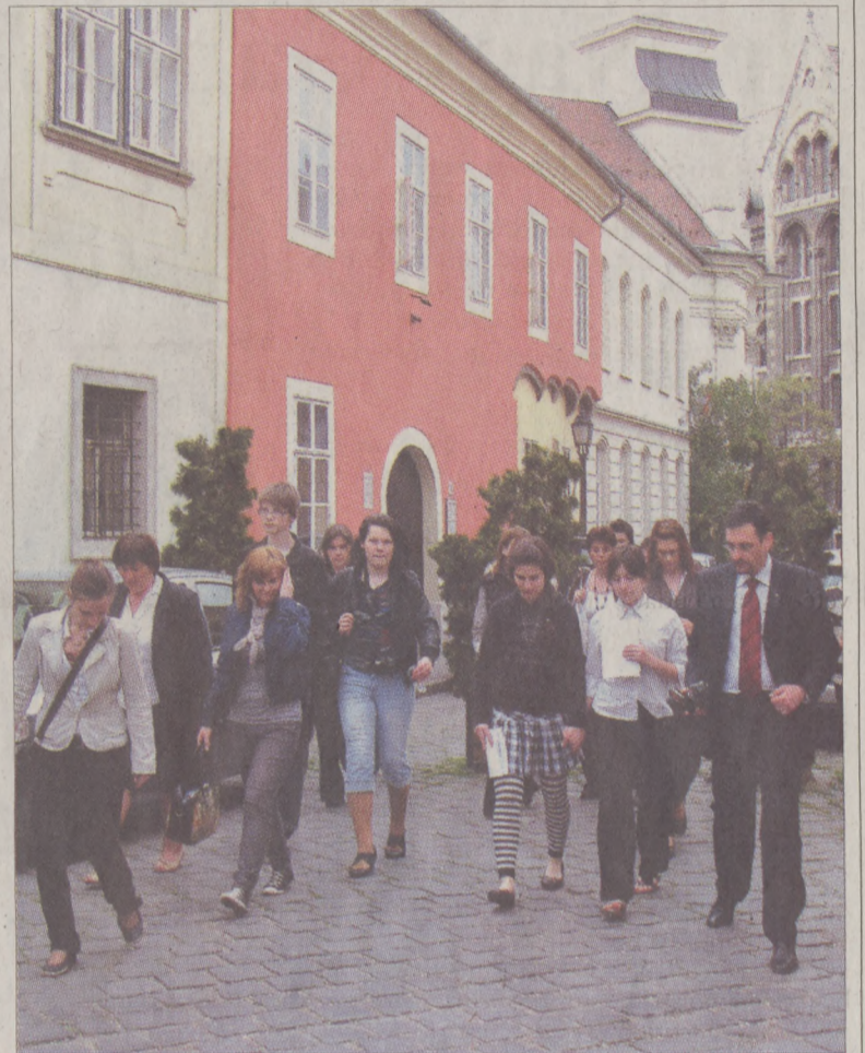
Egykor Beethoven is e falak között járt – a Vár nevezetességeit a kerület vezetője mutatta be az országos vetélkedő döntőjébe jutott diákoknak

Beethoven budai koncertje kapcsán ennek az életfilozófiának az előzményeivel találkozhatunk. Bár a zeneszerző 210 évvel ezelőtt József nádor és ifjú felesége, Alexandra Pavlovna meghívására érkezett hazánkba, magyarországi kötődései ennél jóval mélyebben gyökereznek. A magyar főnemesség számos jeles képviselője már 1795-ben, Beethoven első művének előfizetői között szerepelt. Az Artária zeneműkiadó cég előfizetési felhívásán szereplő 121 aláírás között ott találjuk mások mellett Almássy, gróf Apponyi, Beleznyay, gróf Brunswick, gróf Zichy kézjegyét is. Az akkor még fiatal mester szíves viszonyban állt a Batthyány, Koháry,